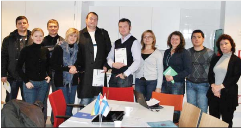
Візит до Технологічного Університету "Аалто", Фінляндія 2011 р.

У рамках проекту кафедрою на базі КНУБА було розроблено і представлено website "Центру управління земельними ресурсами", http://land.knuba.edu.ua . В роботі Центру задіяні викладачі КНУБА і всіх університетів-партнерів проекту.