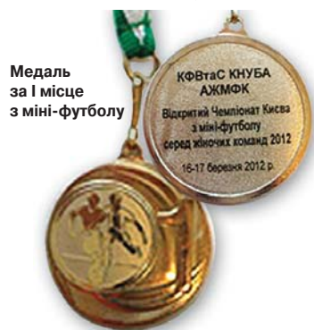
Медаль за I місце з міні-футболу