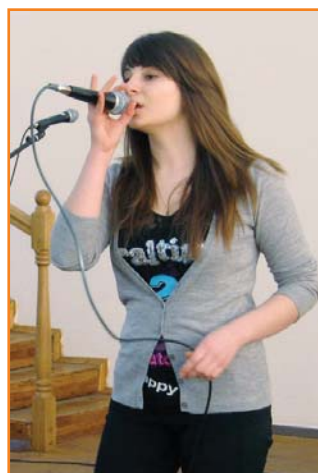
Співає солістка театру "Крила ангела"