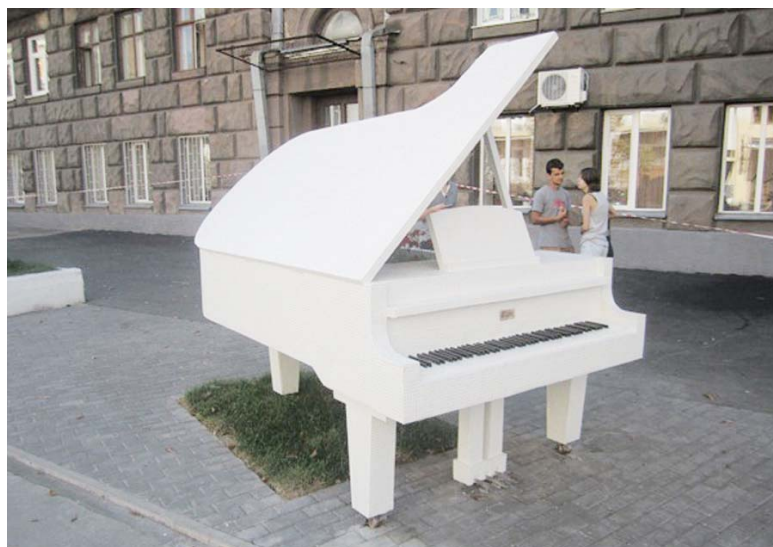
Київське чудо з мозаїки в центрі міста

Ось таке собі чудо з'явилося у вересні 2011 року в центрі нашого славного міста! Рояль виконаний із білої мозаїки і ефектно виділяється як на тлі сусіднього темно-сірого будинку, так і асфальту. Здогадаєтеся, хто є скульптором?