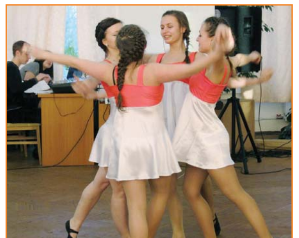
Виступає збірна КНУБА з танцювальної аеробіки