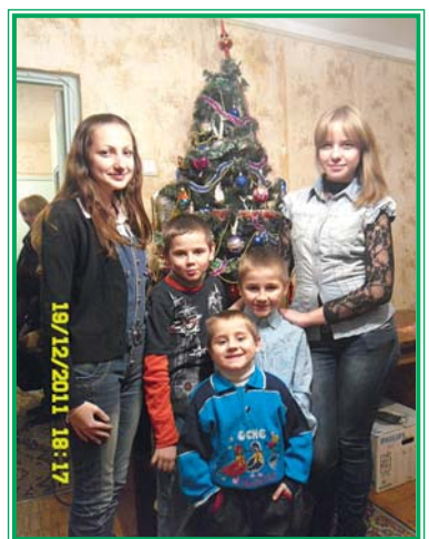
Волонтери з дітлахами

Життя отримав кожний, але доля написана – своя, тому... дуже боляче дивитись на людей, які дійсно потребують допомоги. Ми впада-