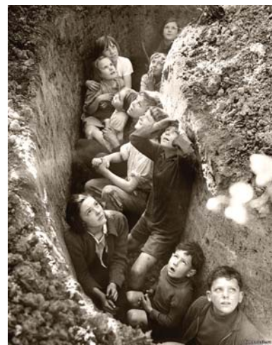
В окопі сталінградські діти, 1943 р.

мирного населення. Скільки тисяч сталінградців загинуло в ті дні в підвалах обвалених будівель, задихнулося в земляних сховищах, згоріло заживо в будинках – ніхто не знає. – Наш будинок згорів. Ми бігли по вогненному коридору вниз, до Волги, яку через дим не було видно, хоч вона була зовсім близько. Навколо чути крики збожеволілих від жаху людей. На вузькій кромці берега скупчилося багато народу. Поранені лежали на землі разом з мертвими. На горі, на залізничних шляхах вибухали вагони з боєприпасами. Раптом побачили невеликий буксирний пароплав. Ледве піднялися по трапу, як пароплав відійшов. Оглянувшись, побачив суцільну стіну палаючого міста. Сотні німецьких літаків, низько спускаючись над Волгою, розстрілювали жителів, які намагалися переправитися на лівий берег. Річковики вивозили людей на звичайних прогулянкових пароплавах, катерах, баржах. Фа-