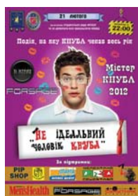
Так виглядала Афіша

Чоловіча краса – поняття дуже специфічне і індивідуальне. Це стосується як зовнішньої, так і душевної вроди. Мужність, сміливість, розум та почуття гумору в усі часи робили щасливчиків, які володіють цими рисами, улюбленцями жінок. Уявіть собі, як важко обрати серед чотирнадцяти ідеальних представників сильної статі одного найдостойнішого. Саме таке нелегке завдання постало перед журі конкурсу "неідеальний чоловік КНУБА". Відбувся він 21 лютого у клубі FORSAGE напередодні Свята захисника Вітчизни. Організатором виступив факультет Геоінформаційних систем і управління територіями.