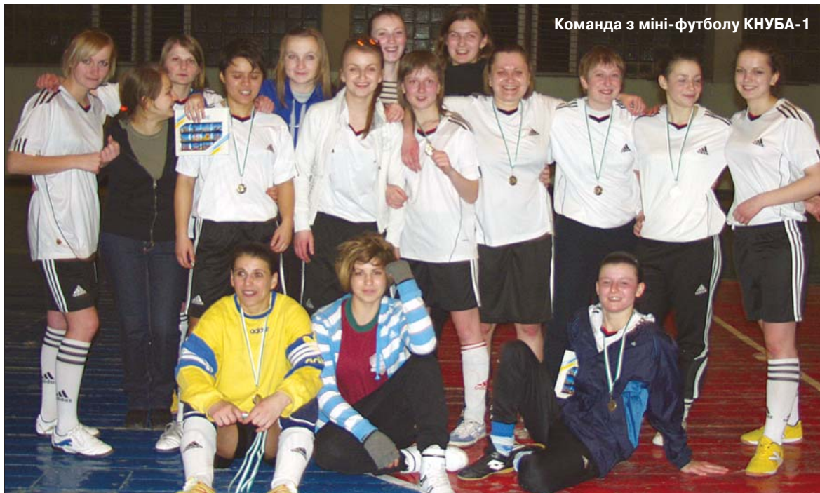
Команда з міні-футболу КНУБА-1