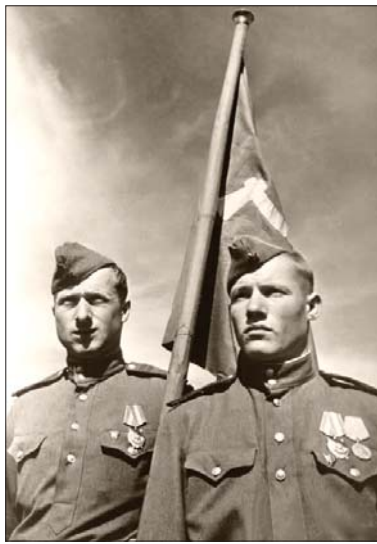
Розвідники 796 полку 150-ї стрілецької дивізії Михайло Єгоров (справа) і Мелітон Кантарія з Прапором Перемоги. Берлін. Травень 1945

• Великий внесок у справу Перемоги у Великій Вітчизняній війні внесли й інші республіки СРСР. Ніхто не стояв осторонь від загальної Перемоги, ніхто не був байдужий до долі улюбленої Батьківщини. Що стосується Радянської України, то вона не просто внесла свій вклад у розгром ненависного ворога, а й разом з Російською Федерацією і Білоруссю внес-