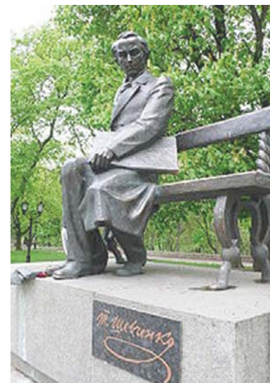
Пам'ятник Т.Шевченку в Чернівці