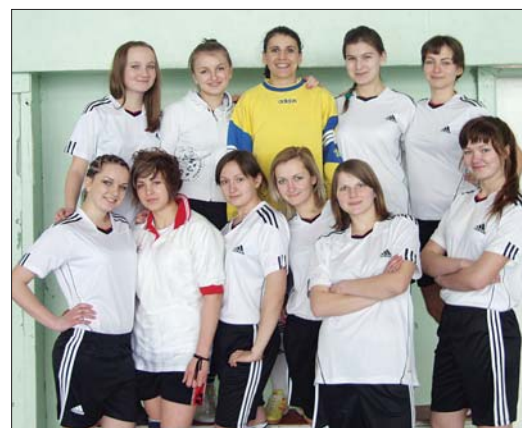
Команда гравців КНУБА-2

Редактор Ірина Герасченкова АДРЕСА РЕДАКЦІЇ: 03180, м. Київ-180, Повітрофлотський проспект, 31, кімн. 608а, тел. 241-55-35