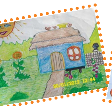
Діти намалювали свої мрії

Міжнародна громадська організація "Цивілізація культури духовності і роз-