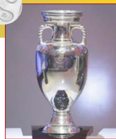
Кубок Анрі Делоне, який завоювали іспанці – переможці УЕФА Євро-2012

болістами Євро-2012 були визнані португалець Кріштіану Роналду, швед Улоф Мельберг, француз Самір Насрі, німець Bastian Швайнштайгер і гравець збірної Англії Ешлі Янг.