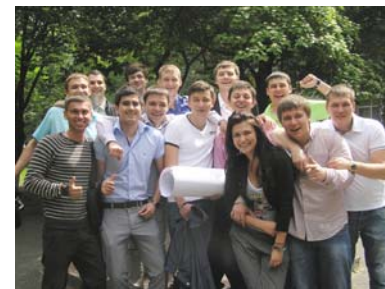
Випускники ПЦБ після захисту диплома Фото на пам'ять!

Протягом червня в нашому університеті проходили урочисті заходи – випускники КНУБА 2012 залишали стіни своєї Альма-матер. На випусках газета А+Б підслухала й записала декілька цікавих думок і побажань, які висловлювали декани, викладачі, співробітники, та вирішила об'єднати їх в одну коротеньку замітку.