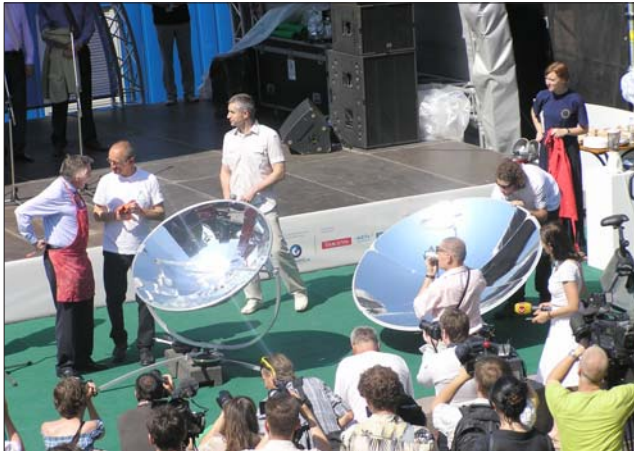
Геліоконцентратори в дії

18 червня на відкритті тижня "Сталої Енергетики" були присутні Голова Представництва ЄС в Україні Жозе Мануел Пінту Тейшейра, Посол Німеччини Ганс-Юрген Гаймзют, Посол Фінляндії Ар'я Макконен, Посол Польщі Генрик Літвін, Посол Австрії Вольф Дітріх Хайм, Перший заступник голови Київської міської державної адміністрації Олександр Мазурчак, Голова Державної агенції з енергоефективності та енергозбереження Микола Пашкевич, інші європейські дипломати та українські урядовці.