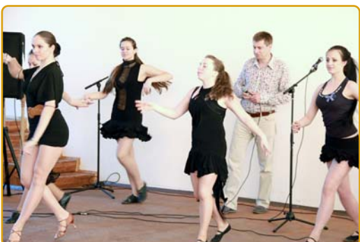
Велике задоволення від виступу дівчат зі збірної КНУБА з танцювальної аеробіки