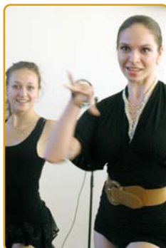
Танцювальна аеробіка – прикраса програми