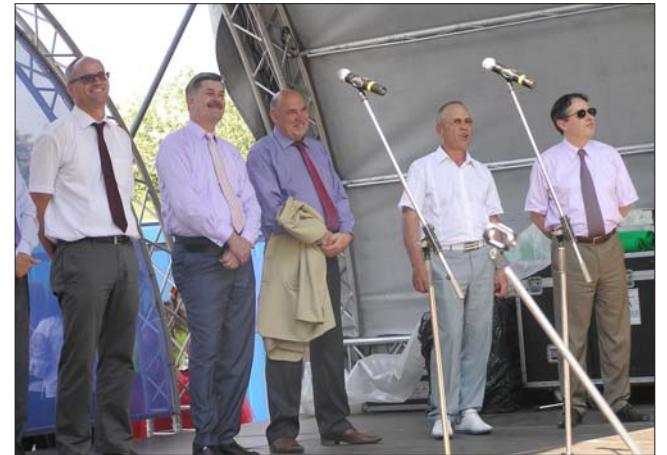
Європейці вчитимуть економії використання енергії

За цей час проведено кілька круглих столів та продемонстровано енергоощадні установки. Зокрема, сонячні батареї та вітряки. Своїм досвідом ділилися спеціалісти з різних країн Європи, зокрема, Німеччини, де енергозберігальні технології використовуються вже майже 30 років.