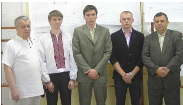
Після захисту – фото напам'ять!

новні параметри цього конструктива з використанням сучасних методів розрахунку, а також розрахована стійкість ухилів, насипу тощо.