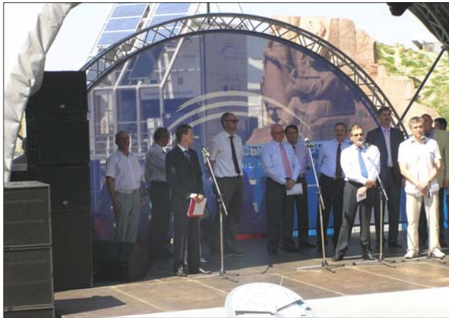
На відкритті тижня енергетики

Влітку під аркою Дружби Народів в Києві було розташовано "Європейське містечко". Це спільний проект Представництва Європейського Союзу в Україні, Київської міської державної адміністрації, що здійснюється в рамках міжнародного українсько-німецького співробітництва. Він тривав протягом місяця (2.06–1.07.2012) і презентував нову, далекоглядну, інновативну та різноманітну Європу, а також найкращі практики в одинадцяти обраних сферах міжнародного співробітництва.