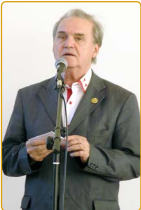
Проф. Є.О.Рейцен читає вірш на тему війни