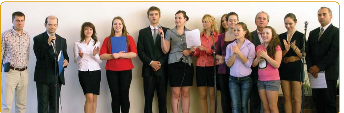
На закінчення всі учасники заспівали "День Перемоги"