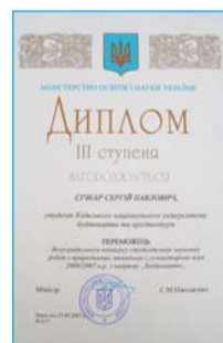
Диплом III ступеня – студенту С. Січкару