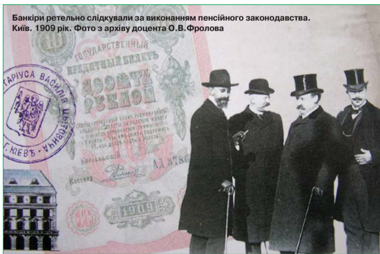
Банкіри ретельно слідували за виконанням пенсійного законодавства. Київ. 1909 рік.