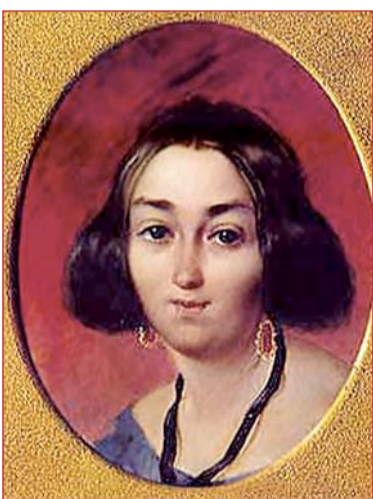
Т. Шевченко. Портрет Ганни Закревської. Олія

Спочатку вабила його акварель. Серед портретів, створених Шевченком у цей період, є портрети погрудні, поясні, на цілий зріст, а також портрети, які стоять на межі портретного та побутового жанрів. У цих творах простежується прагнення митця підкреслити гармонійну сутність людини. Для Шевченка людина – міра всіх речей, він бачить і виявляє у ній прекрасне й високе. Жодна тінь душевного неспокою, здається, не затьмарює обличчя портретованих. Часто це його знайомі, приятелі, лагідні, шляхетно вдягнені жінки. Образи ці оповиті своєрідним романтичним серпанком. І це не дивно: в європейському мистецтві настала епоха романтизму. Під впливом