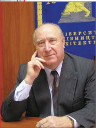
Ректори є над чим замислюватися

Напрямок наукової діяльності заслуженого працівника освіти України, першого віцепрезидента Спілки ректорів вузів України, почесного професора Асоціації будівельних вищих навчальних