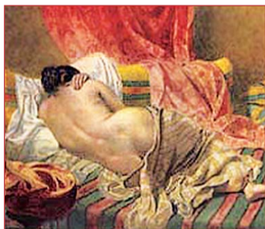
Одалистка. 1840 р.

У Петербурзькій академії мистецтв Шевченко добре опанував техніку олійного живопису. 1840 року він був нагороджений медаллю другого ступеня за