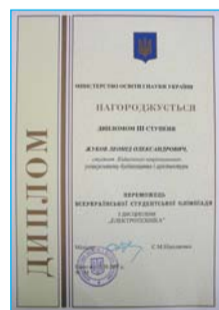
Диплом III ступеня – студенту Л. Жукову