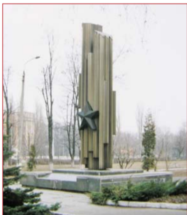
Пам'ятний знак загиблим під час Великої Вітчизняної війни студентам, викладачам і співробітникам КНУБА