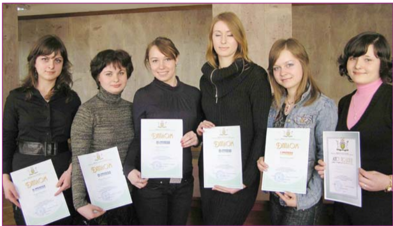
В руках студентів – низка дипломів