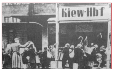
Відправка киян до Німеччини товарняком. 1942 р.