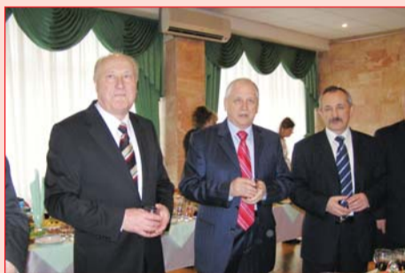
Ювіляра вітають науковці