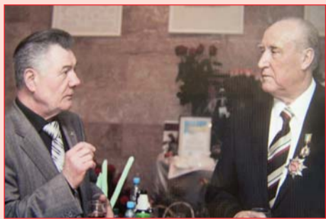
Герой України, випускник КНУБА О.Омельченко