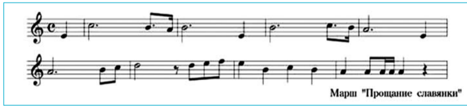
Марш "Прощання слов'янки"

До редакції А+Б звернулася група студентів КНУБА і попросила розповісти про історію створення відомого маршу "Прощання Слов'янки", якому виповнилося недавно 95 років, і опублікувати в А+Б його слова. Добре, що молодь університету знає про існування цього маршу. Виконуємо ваше прохання. Трохи історії.