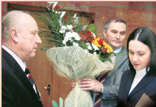
Вітання від Президента