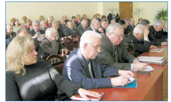
На конференції трудового колективу