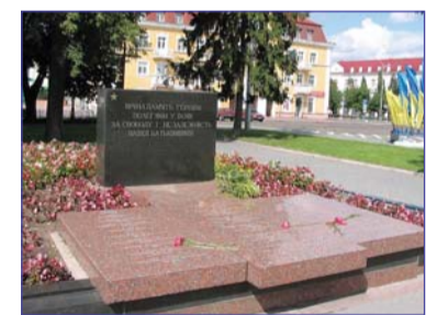
Чернігів. Красна площа. "Вічна пам'ять героям"

Чернігів став потужним промисловим і культурно-освітнім центром