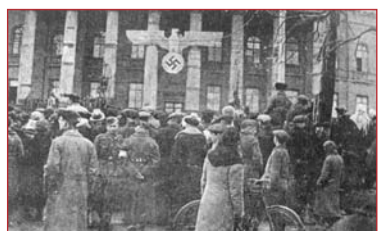
Мітинг киян біля університету ім. Шевченка, присвячений святу 1-го травня. 1942 р.