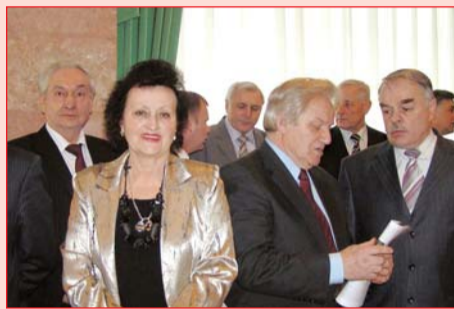
Ректори київського регіону