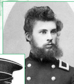
кою тепер іменуються e-mail адреса.