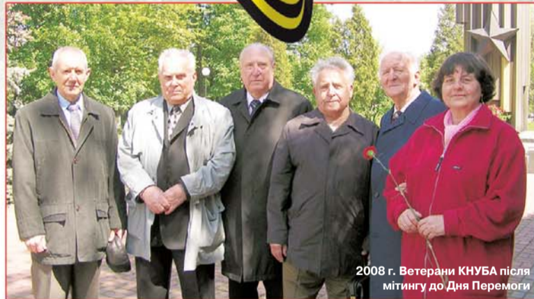
2008 г. Ветерани КНУБА після мітингу до Дня Перемоги

Це найулюбленіше, найщиріше свято! Його так цінують і люблять мої батьки. Я сам з Луганщини й тому знаю, наскільки вагомий внесок у Перемогу мої земляків. За роки війни в Діючу Армію було направлено понад 400 тисяч людей. Понад чверть мільйона не повернулося з війни. Мої земляки були серед тих, хто першими зустріли ворога на Західному кордоні. 22 червня 1941 року над Брестом пішов на таран льотчик – винищувач Петро Рябцев (уродженець г.Петровське Краснолуцької міськради). А наприкінці війни, 23 квітня 1945 року, у важкому бою екіпаж молодшого лейтенанта Івана Решетника (до війни – слюсар паровозобудівного заводу), витративши боєприпаси, пішов на таран німецького "тигра". Випускник Луганської школи воєнних льотчиків Микола Гастелло кидав палаючий літак на скупчення німецьких танків і автомашин. В.Чернопащенко з Рубіжного над Чорним морем таранить німецький бомбардувальник, щоб урятувати танкер "Куйбішев", що йде з палем у Севастополь, який обороняється. І.Биков з-під Северодонецька кидав підбитий літак на німецький сторожовий корабель у Фінській затоці... Ворожий танк був знищений. Загинули й радянські танкісти. Я вважаю, що внесок Луганщини у Велику Вітчизняну