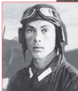
Льотчик Микола Гастелло