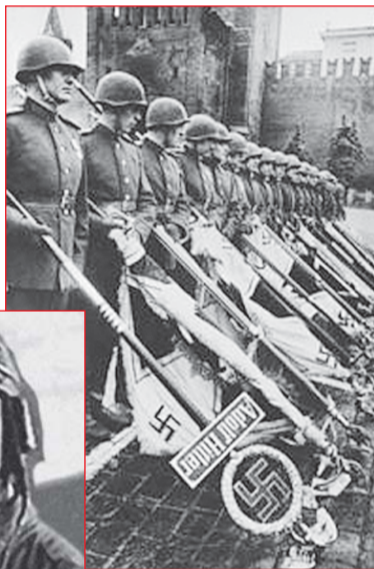
1945 р. Повалені до ніг ворожі штандарти

Невблаганно йдуть, розчиняються у вічності люди, причетні до Великої війни – покоління переможців. Вони урятували цивілізацію для прийдешніх поколінь. Ми завжди будемо пам'ятати про вас, завжди будемо пишати своєю спорідненістю з вами!