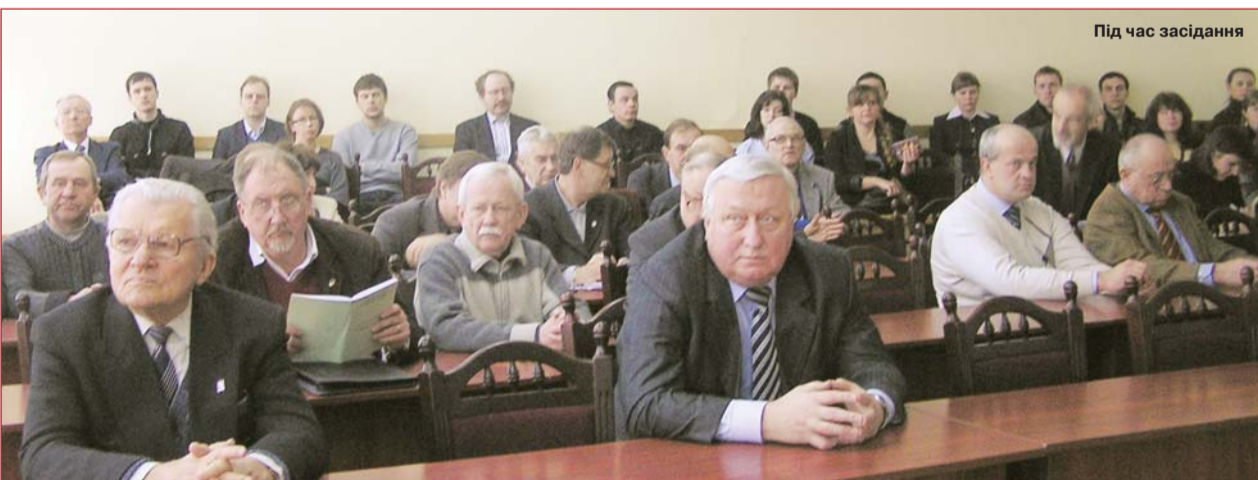
Під час засідання

5. Розділ "Додаткові пільги і виплати": 7.11 виключити, як такий, що не відповідає законодавству. Додаток 5 – виключити, пункт 20 у зв'язку з припиненням діяльності санаторія-профілакторія. У всіх розділах замінити слово "медпункт" на "оздоровчий пункт".