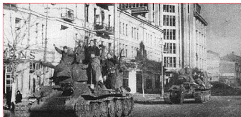
1943-й – визволителі з Т-34 на Хрещатику