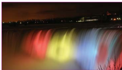
"Разноцветный поток света направляется на Подкову"