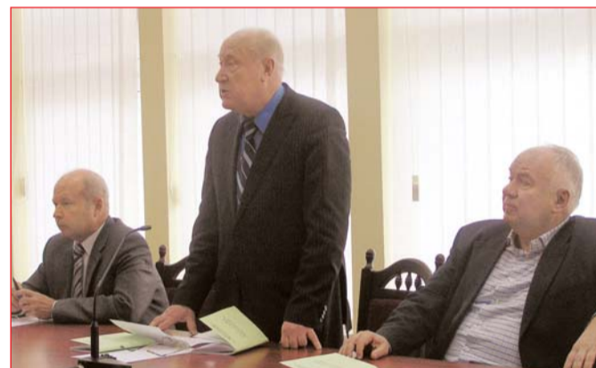
Під час роботи конференції