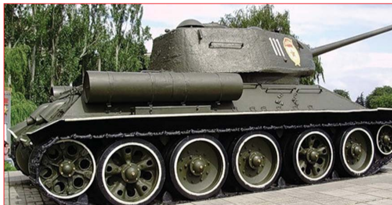
Т-34, що першим увійшов до Києва з боку Нивок 1943 року

Кошкін не розумів захоплення цим зовнішнім ефектом, коли мова йшла про бойову машину. Виникла дискусія: чи потрібен танку колісний хід при наявності гусеничного? Михайло Ілліч запропонував