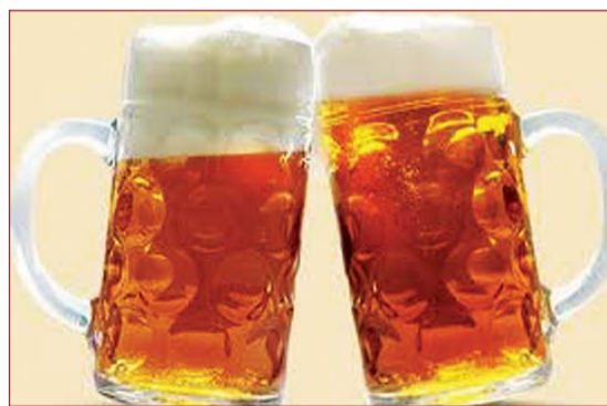
Пиво шкідливе для організму