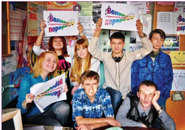
В ефірі радіо "Велика перерва"!