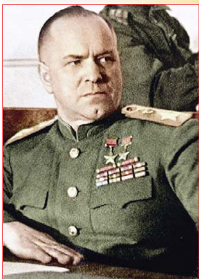
Маршал Георгій Жуков