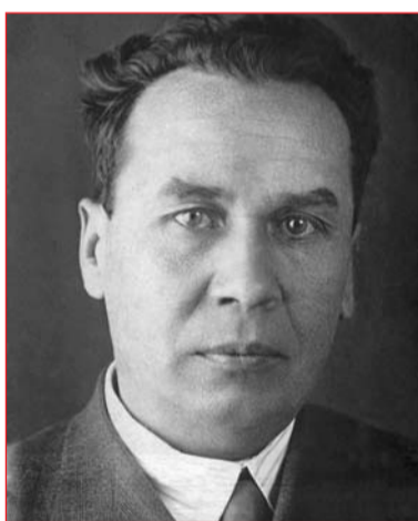
Михайло Кошкін – конструктор Т-34.

Після Другої світової війни У. Черчілль запитали, яка зброя була самою вирішальною для перемоги. Він відповів: "Англійська лінійна гармата, німецький "Мессершміт" і радянський танк Т-34. Побачити танк Т-34 у Києві дуже легко – він встановлений біля станції метро "Шулявська" (колишня "Більшовик") і нагадує про Героя Радянського Союзу Никифора Шолуденка – командира танка, який першим увійшов до Києва з боку Нивок 4 листопада 1943 року. А вже 5 листопада 1943-го Шолуденко загинув у бою, звільняючи Київ, йому було лише 24. (Похований бойовими друзями в Києві на площі Сталіна – зараз Європейська площа. У 1957 році перепохований у парку Вічної Слави – від ред. ). Але повернемося до "тридцятьчетвірки". Хто і як створив чудо-танк?