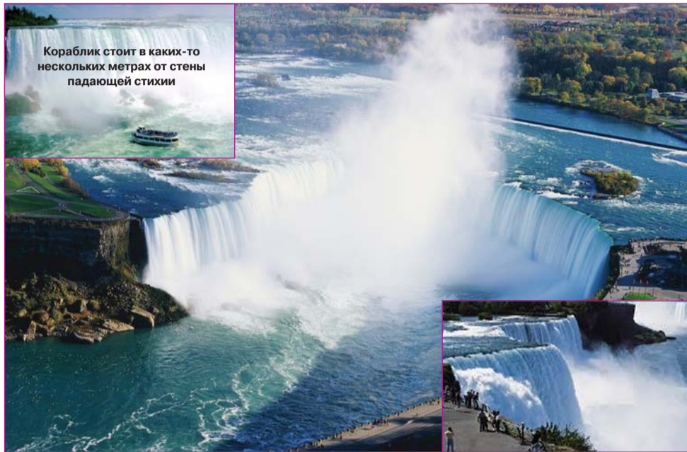
Кораблик стоит в каких-то нескольких метрах от стены падающей стихии

Можно спуститься лифтом в шахту на 15 метров и пройти коридором до выхода из грота – вы окажетесь на смотровой площадке прямо возле водопада, его боковой стороны. Протянув руку, можно дотронуться до мощного потока. И вам покажется, что поздоровались с Великим. Он же ласково окатит вас прозрачной ледяной водой.