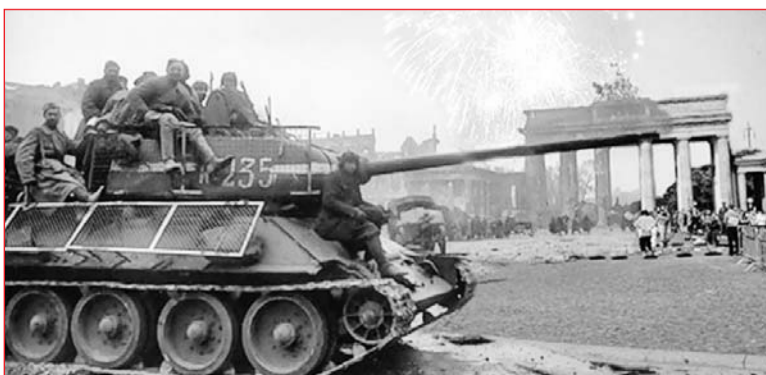
Т-34 в квітні 1945-го на вулицях Берліну

Захистивши диплом в політехнічному інституті по броньованих машинах, молодий спеціаліст М.І. Кошкін трудиться в танковому КБ знаменитого Ленінградського Кіровського заводу (ОКМО). Михайло Кошкін пройшов фронтами першої світової та громадянської воєн, він добре розуміє, як необхідний Батьківщині потужний броньований щит. Працюючи заступником головного конструктора, Кошкін вже встиг одержати орден Червоної Зірки за участь у створенні першого вітчизняного "товстобронного" середнього танку Т-46-5.