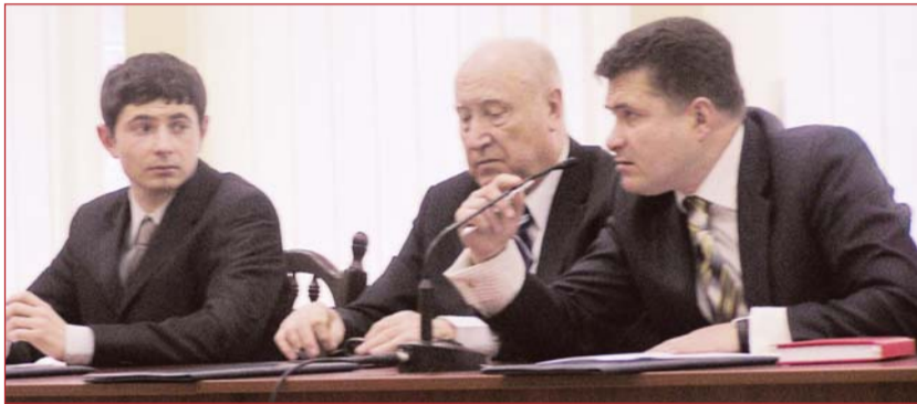
Збори трудового колективу. Президія

Архітектура – бакалавр – 20 тис. грн. в рік; спеціаліст (АБС, МБ,ДАС) – 24 тис. грн. в рік; магістр (АБС, МБ,ДАС) – 28 тис. грн. в рік. Образотворче мистецтво – бакалавр – 16 тис. грн. в рік; спеціаліст – 20 тис. грн. в рік; магістр – 22 тис. грн. в рік; Будівництво – бакалавр – 12 тис. грн. в рік;