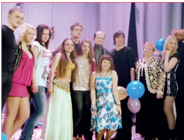
Команда будівельного під час IV туру концерту "Прокинься і співай"