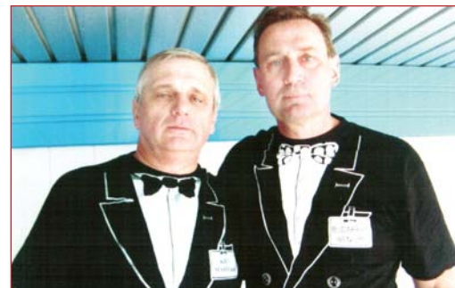
МС Ю.Човнюк та ЗМС, чемпіон Олімпійських ігор С.Фесенко

НАШ САЙТ В ІНТЕРНЕТІ: www.knuba.edu.ua , e-mail: arh_bud@knuba.edu.ua