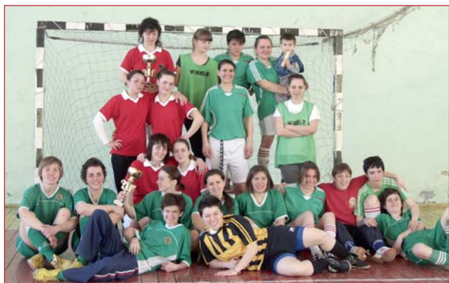
Команда КНУБА з жіночого футболу

15–16 квітня 2011 року вперше було проведено відкритий чемпіонат КНУБА з міні-футболу серед жінок. Попередньо було заявлено 8 команд, однак участь взяли 4 команди. Відома команда України "Белічанка-НПУ" – Національний педагогічний університет, "Александрія", "NRG".