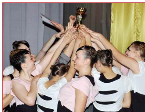
Перемогою дівчата задоволені!