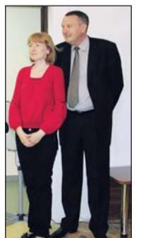
Батьківська доля – переживати за дітей