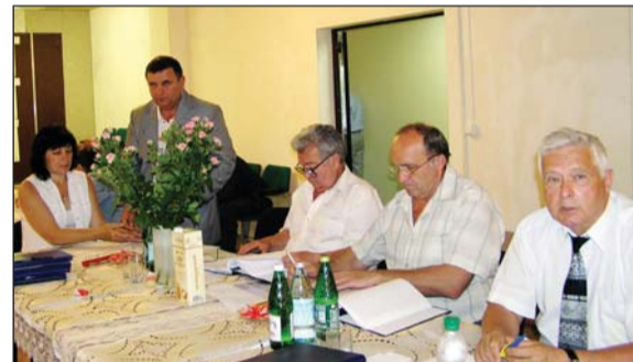
Працює II-га Державна екзаменаційна комісія КНУБА