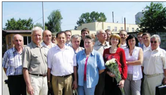
Члени комісії у СПМК-2 тресту "Теплицьтехмонтаж"