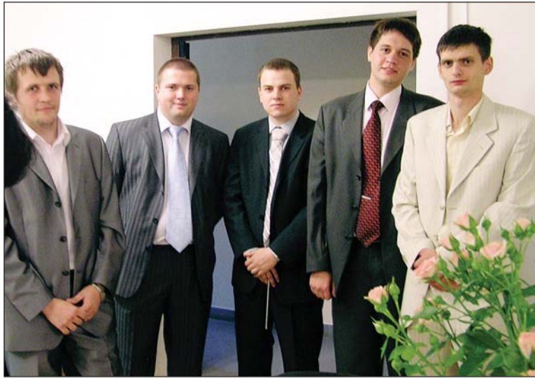
Дипломники перед захистом