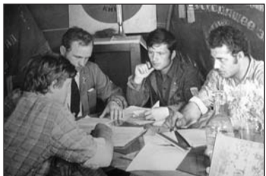
Штаб студентського будівельного загону лени" важкі місцеві підлітки.