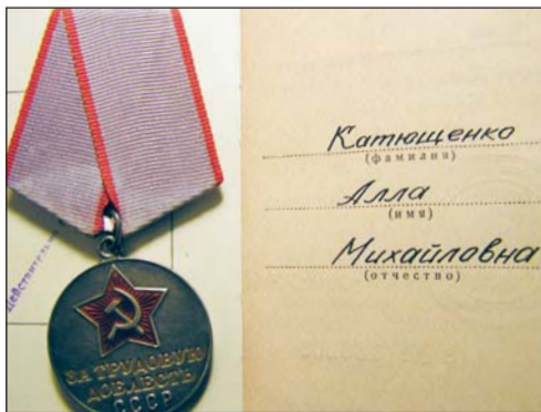
Медаль "За трудову доблесть"

Школу трудових семестрів пройшли будзагонівці КНУБА. Їх робота та відмінне навчання було оцінено країною.