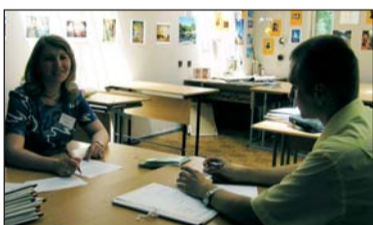
До зовнішнього незалежного тестування ставлення в суспільстві