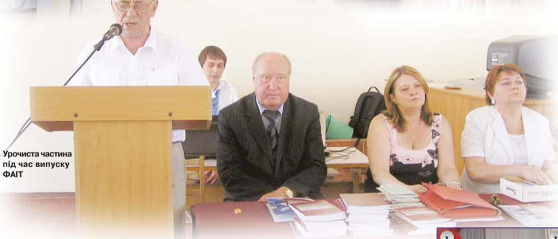
Урочиста частина під час випуску ФАІТ