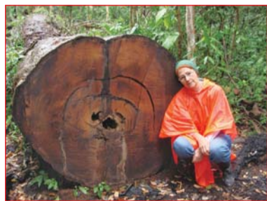
Вековые деревья джунглей