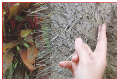
Устрашающие защитные колючки на дереве

Растительный и животный мир амазонской сельвы... Это нужно видеть! Почти целый день идем по тропе, которую Стефан время от времени расчищает мачете, иногда продвигаемся руслом ручья.