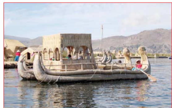
Катамараны из тростника

ны заготавливают тростник, ловят рыбу и мастерят свои знаменитые тростниковые катамараны, женщины на острове готовят пищу, шьют и вышивают. Группа островов объединена мэрией, где есть и начальная школа. Правом строительства владеют только потомки семей, так что уйти от цивилизации и заполнить жизненное пространство пришельцам не удастся: за этим строго следят местные законы. Браки тоже заключаются внутри плавающей колонии.