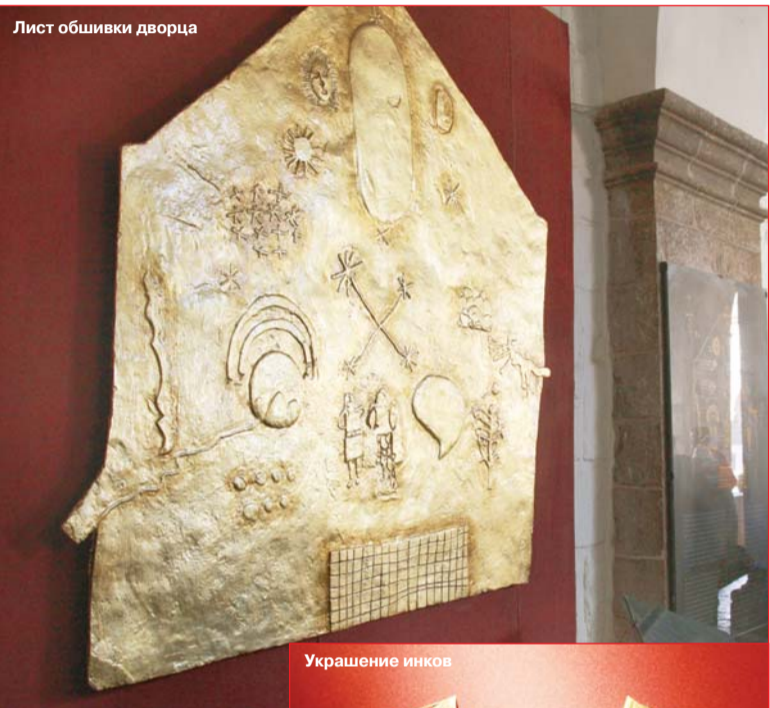
Лист обшивки дворца

Стаи обезьян самых разных видов не идут на контакты, но позволяют себя видеть и слышать, особенно запомнился голос одной из них, децибелы которой доносятся звук за 4 км. Около 65% умираю-