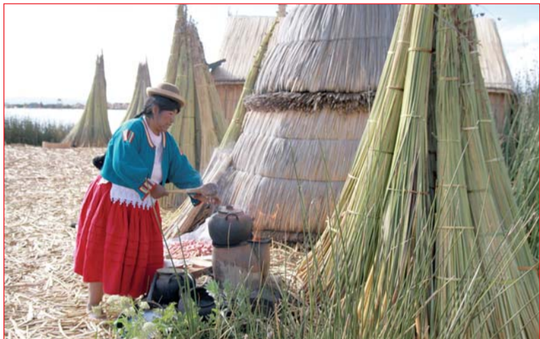
Плавающий остров из тростника Урос

И последнее. В путешествии за тайнами инков я увидела свое седьмое чудо света – Мачу Пикчу (приятно отметить, что предыдущих 5 из 7 я уже посетила!). Этот тур в прекрасную туристическую Мекку под названием Перу – не из дешевых и не из легких, но выбор определяется нашими жизненными приоритетами.