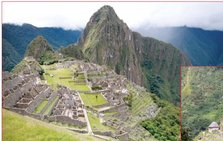
Каменный город Мачу Пикчу

хеологических ценностей из золота, найденных в священной долине инков. Переночевав в монастырском отеле, мы покидаем высокогорную долину, чтобы подняться на высоту 4320 м, увидеть заснеженные вершины Анд и уникальное высокогорное озеро Титикака.