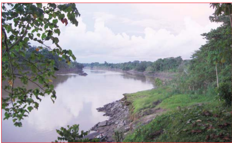
Вечерний закат на притоке Амазонки – р. Тамбапата

Чуть больше часа перелета от Лимы до Пуэрто Мальдонадо переносит нас