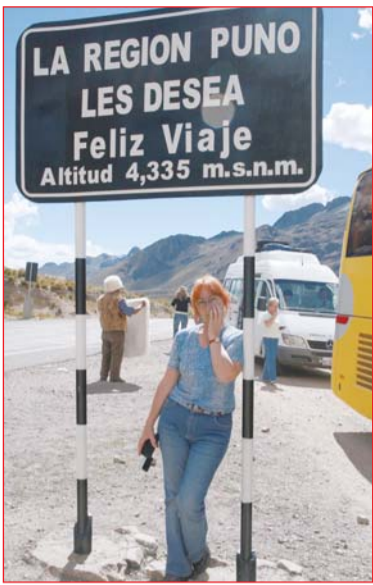
Добро пожаловать в Перу!

Каждая из 31 страны, куда вела меня безудержная тяга к путешествиям, оставила в памяти свой неизгладимый след. Разве можно забыть эмоции восторга от абсолютной гармонии Тадж – Махала, прикосновения к вечности на руинах Мемфиса и Великой китайской стены, гениальности каменной архитектуры Петры! Прекрасно и то, что теперь мы можем увидеть культуру Европы, узнавая в Лондоне, Париже, Вене, Риме и Флоренции то, что читали раньше в книгах. Восторг же от знакомства с далекой латиноамериканской страной Перу оказался таким, что захотелось поделиться впечатлениями с читателями нашей многотиражки.