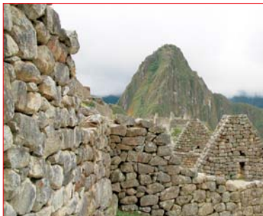
Горный перевал над озером Титикака

воности сооружений. Почему свою загадочную жемчужину, каменный город Мачу Пикчу, они построили на высоте свыше 2000 м в то время, как внизу, в долине, протекает река и условия строительства более просты? Для чего так широко и довольно неожиданно использовали самый токопроводящий металл медь, например, в пазах каменных стеновых блоков, в листах под соломенной кровлей? Есть версии о космических связях этой цивилизации и множество доказательств ее подобия египетской и