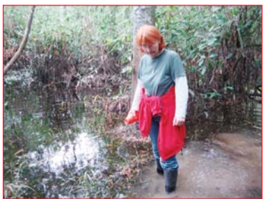
Русло ручья – тропа в джунглях