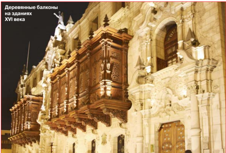
Деревянные балконы на зданиях XVI века