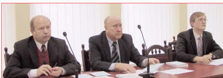
Президія студентської наукової конференції

Наукові конференції молодих вчених, аспірантів і студентів КНУБА – це веління часу, розвиток наукової думки, творчий пошук і конкретні результати. Чергова, третя, така конференція пройшла в стінах університету 4-6 листопада 2008 року. Відкрив і привітав молодих дослідників ректор, д.т.н., професор А.М. Тугай.