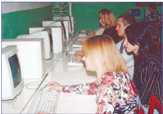
Понад 40 тис. чоловік зареєструвалося на пробне тестування

Ще у вересні Міністерство освіти і науки оприлюднило свої Умови прийому. На підставі цього документа вузи мали до 1 листопада цього року розробити власні Правила прийому і у триденний строк надіслати їх до Міністерства освіти і науки. Це потрібно насамперед для того, щоб учасники пробного незалежного тестування, яке почалося 1 листопада і тривало до 1 грудня, знали, які саме предмети у тому чи іншому вузі будуть конкурсними і які потрібні будуть сертифікати Українського центру оцінювання якості освіти. Правила прийому до КНУБА були надіслані до МОН і виставлені на сайті університету вчасно.