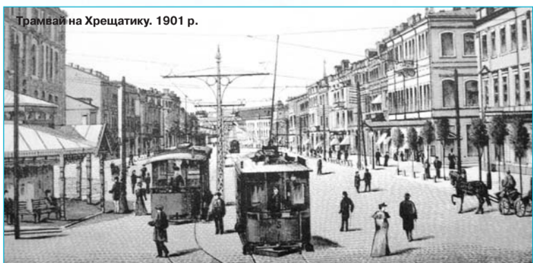
Трамвай на Хрещатику. 1901 р.

Справді, як влучно охрестив народ безоплатних пасажирів міського тран-