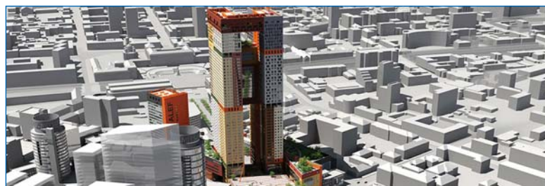
Висотний комплекс "Брама" у Дніпропетровську

функціонує 33-поверховий торговельно-офісний комплекс в умовах надзвичайно щільної забудови центральної частини міста на перетині вул. Мечнікова та бульвару Лесу Українки. Неподальок від названого об'єкту на Спортивній площі споруджується експериментальний висотний торговельно-офісний комплекс з 6-ти поверховим підземним паркінгом.