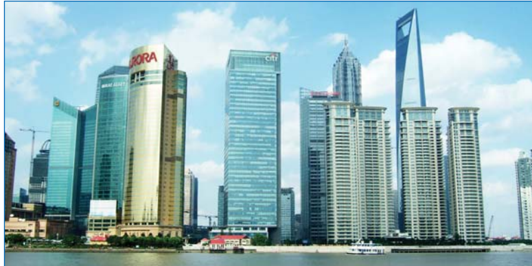
Всесвітній фінансовий центр в Шанхаї – найвища будівля в Китаї – 492 метра. 101 поверх. 2008 р