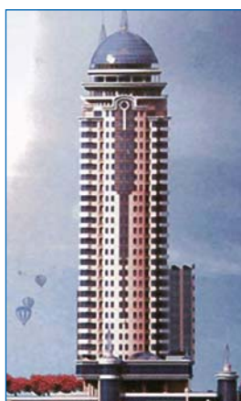
Житлово-громадський комп. на вул. Старигородській у Києві