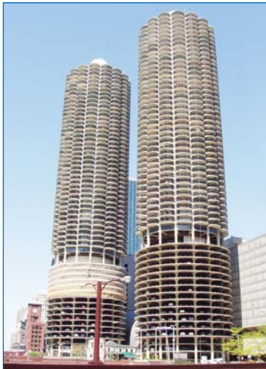
Житлові башти "Марина Сіті" Чикаго, 60 пов, 179 м., 1964 р