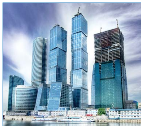
"Москва-Сіті" комплекс. Вежа "Федерация". 354 м

ній гіперконцентрації їх у великих містах. Він запроєктував надвисокий будинок, який доцільно розміщувати в гармонії з природою в невеликих поселеннях.