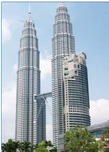
Вежі нафтової компанії Петронас. Куала Лумпур. Малайзія. 452 м. 1990 р