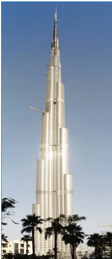
Бурж Дубай – найвища будівля в світі. Дубай, ОАЕ. 160 пов. 828 м.

Активно розвивається висотне будівництво в Росії, особливо в Москві, де вартість землі, як вважають економісти, навіть вища від Парижу, Лондону і близька до Нью-Йорку. Москва давно