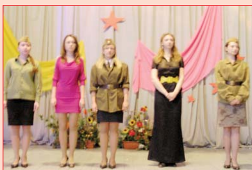
Студентки КНУБА – учасниці концерту для фронтовиків

Традиційно, 6 травня, в університеті проходить мітинг, присвячений Перемозі у Великій Вітчизняній війні. На нього запрошують учасників бойових дій, ветерани – колишні співробітники Університету, студенти. Цього разу надзвичайно зворушливо було чути, як під час концерту, підготовленого студентами для ветеранів, фронтовиків і учасників війни співали разом з молоддю найпопулярнішу й улюблену "Катюшу". Спасибі вам за це, повторювали всі після мітингу! Пізніше, під час святкового обіду для ветеранів війни, прекрасні спогади подарували гостям учасники оперної студії КНУБА, підготувавши концерт фронтових пісень.