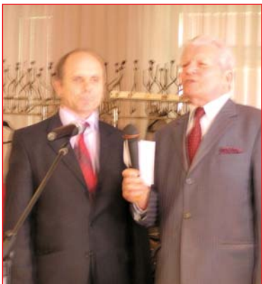
Співають учасники оперної студії П.П.Черверда і В.Є.Михайленко

Традиційно, 6 травня, в університеті проходить мітинг, присвячений Перемозі у Великій Вітчизняній війні. На нього запрошують учасників бойових дій, ветерани – колишні співробітники Університету, студенти. Цього разу надзвичайно зворушливо було чути, як під час концерту, підготовленого студентами для ветеранів, фронтовиків і учасників війни співали разом з молоддю найпопулярнішу й улюблену "Катюшу". Спасибі вам за це, повторювали всі після мітингу! Пізніше, під час святкового обіду для ветеранів війни, прекрасні спогади подарували гостям учасники оперної студії КНУБА, підготувавши концерт фронтових пісень.