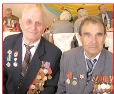
Фронтовики КНУБА. 6 травня 2010

були окупантами. Вони гинули і проливали кров за Україну так само, як і багато хто з ветеранів УПА. От лише образ України в них був різний. Але і для одних, і для інших – це була Батьківщина, земля їх пращурів. У тому, що вони не зуміли порозумітися (ні тоді, ні зараз) є їх трагедія й трагедія нашого народу. Хизуватися тут нема чим. Сприймати історію слід такою, яка вона є, та робити з неї висновки.