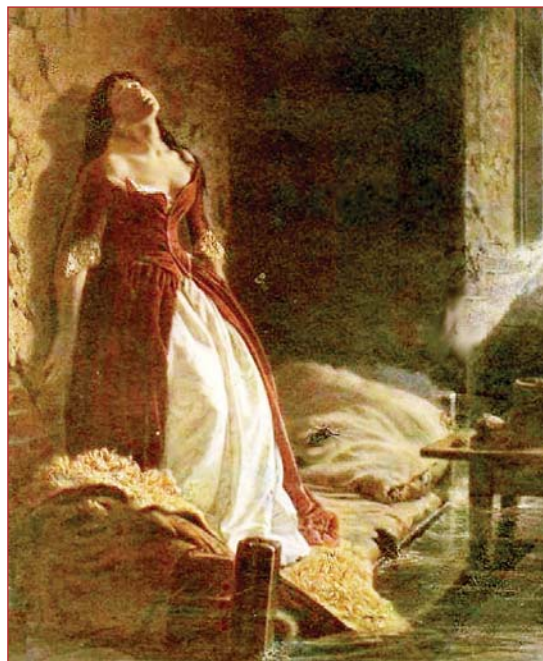
К. Д. Флавицкий. "Княжна Тараканова", 1864, Государственная Третьяковская галерея

P.S. Немного истории. Отличаясь редкой красотой и умом, также тягой к неумеренной роскоши Елизавета Алексеевна объявила себя дочерью императрицы Елизаветы Петровны и Алексея Разумовского, сестрою Пугачёва и претенденткой на русский престол. В письмах говорила о своем происхождении от Елизаветы Петровны, представляя даже вымышленное духовное завещание императрицы, о житье при матери до девятилетнего возраста, затем у шаха персидского, о намерении при помощи Пугачёва занять престол... Арестованная по приказанию графа Алексея Орлова в Ливорно, она в мае 1775 г. была доставлена в Петропавловскую крепость, подвергнута допросу, во время которого давала различные показания. Умерла от чахотки 4 декабря 1775 г., скрыв тайну своего рождения даже от священника. Жизнь её не раз служила темой для романистов, в том числе для Г. П. Данилевского, написавшего в 1883 г. роман "Княжна Тараканова".