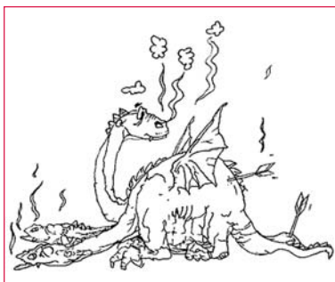
Таланти наших студентів

Також наші спудеї, буваючи у вищих Східної України, відзначають, що таке