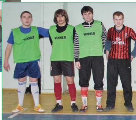
Чемпіони кубку КНУБА з мініфутболу команда санітарно-технічного факультету

А тепер перейдемо до самих змагань. Щоб потрапити у фінальний раунд, командам спочатку треба було пройти сито