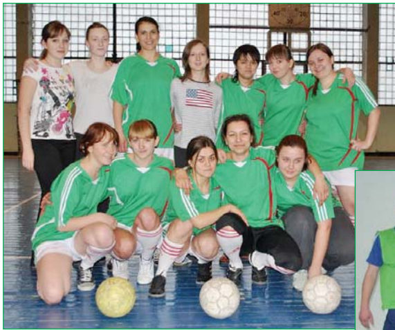
Жіноча збірна КНУБА з футболу

Слово спортивному коментатору газети "Архітектура і Будівництво" Віталію Лозинському, студенту АТП-42: