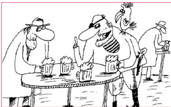
Ці рисунки ми сфотографували на партах в аудиторіях нашого університету

І. Червоненко, завідувач лабораторії КНУБА