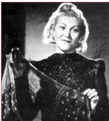
Клавдія Шульженко. 1942 р.