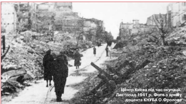
Центр Києва під час окупації. Листопад 1941 р.