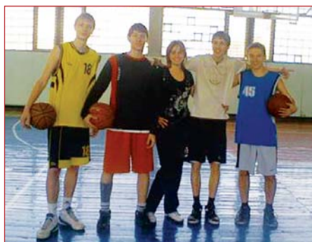
Команда факультету АІТ – чемпіони першості КНУБА з баскетболу