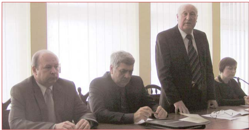
Президія 71-ї науково-практичної конференції КНУБА