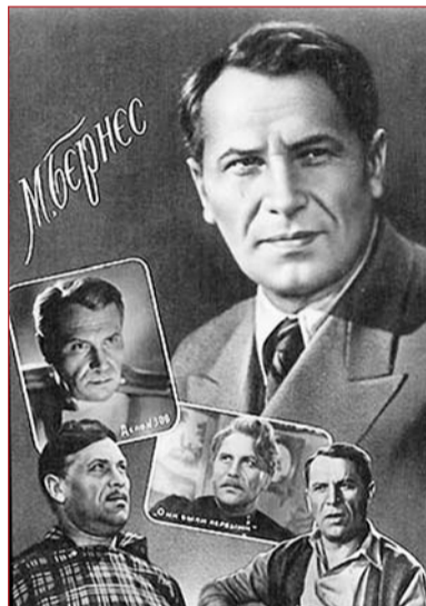
Марк Бернес – виконавець пісні "Темная ночь"

Пісні у ті чотири довгих роки були більше ніж пісні. Уявити війну можна за картами битв і мемуарів, але справжню правду про людей можуть розповісти тільки пісні і листи. Війна не лише прожита – вона проспівана: від "Пусть ярость благородная..." у 1941 р. до "Праздника со слезами на глазах..." у День Перемоги, "Огонек", "Темная ночь", "Давай закурим", "Жди меня" і багато інших пісень, які написані в роки Великої Вітчизняної – справжні шедеври музичної лірики.