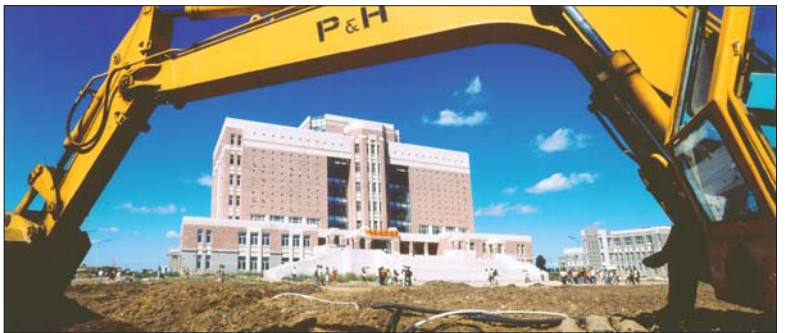
Китай. Будівництво університетської бібліотеки в м. Шеньян