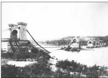
Залишки ланцюгового мосту

До 1900 року міст мав розв'язку частину для пропуску мачтових судів, що