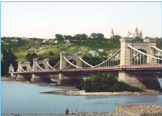
Таким був Ланцюговий міст у Києві

Розвиток Києва вже давно вимагав зведення постійного мосту через Дніпро. Ще 1829 року на необхідність такого мосту звертав особливу увагу імператор Микола I.