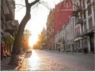
Тверде покриття на київській Прорізній вулиці. 1913 рік

На кінець XIX століття в Києві налічувалося 230 вулиць і 17 площ, які висвітлювалися майже 2000 газовими ліхтарями. У цей період дорожня інфраструктура міста почала розвиватися стрімкими темпами. Почали проводитися масштабні роботи з вимощення нових та ремонту старих вулиць. Київ був першим серед міст Імперії, де почали будуватися мозаїчні бруківки на бетонній основі. Ці роботи охопили центральні магістралі: вулиці Хрещатик, Олександрівську, Миколаївську, Володимирську та ін. Граніт для цієї бруківки завозився зі Швеції. Вже в 1912 році половина вулиць міста мала тверде покриття.