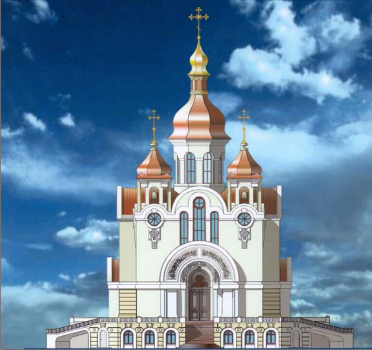
Церква Покрови Святої Богородиці в м. Боярка