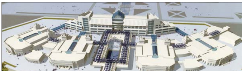
Проект лекційних аудиторій в м. Шеньян