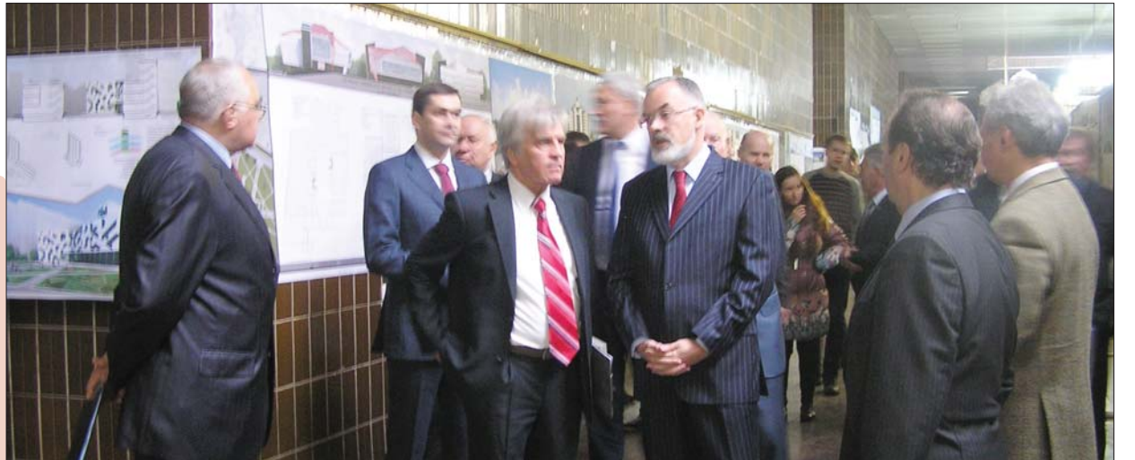
Міністр освіти Д.В. Табачник оглядає виставку дипломних робіт на архітектурному факультеті

Китаю, Молдови, Росії, голови і члени ДЕКів, що працювали цього року, викладачі, студенти та їх батьки.