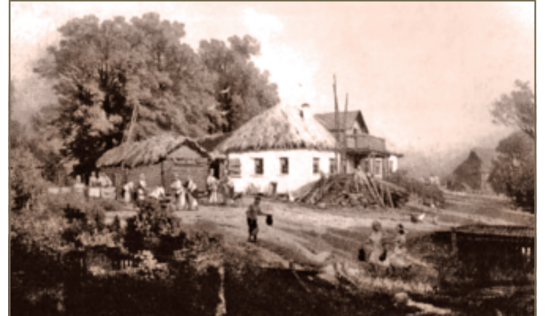
Так виглядела Россось для кирилловських переселенців ХІХ век.

ли. Сім душ в сім'ї ростила, а ще троїх схоронила.