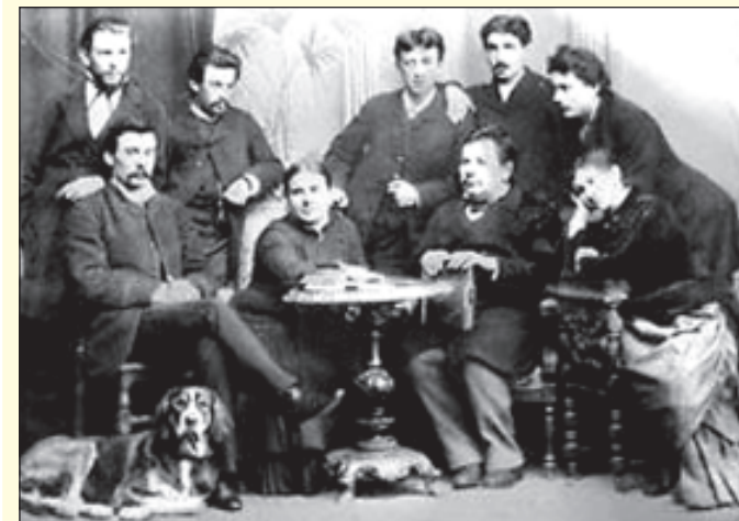
Трупа корифеїв Марка Кропивницького, актора, режисера, драматурга. 1882 рік.

Українська тематика присутня також у творчості Ференца Ліста, подорожуючого по Україні в кінці 1840 х. Це п'єси для фор-