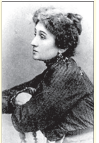
Марію Заньковецьку не можна було не любити. Репертуар її налічував понад 30 ролей. 1900р.