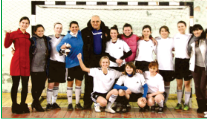
Наша перша перемога!

3 ПЕРШОГО ГРУДНЯ 2013 року розпочався чемпіонат м. Києва серед жіночих команд, який проходить в ігровому залі спорткомплексу КНУБА. Він проходить за круговою системою, тобто кожна команда грає з кожним. В чемпіонаті беруть участь 7 команд: