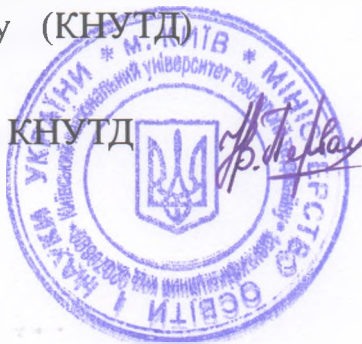
Первая Н. В.