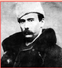
Микола Садовский в 80-е годы XIX ст.