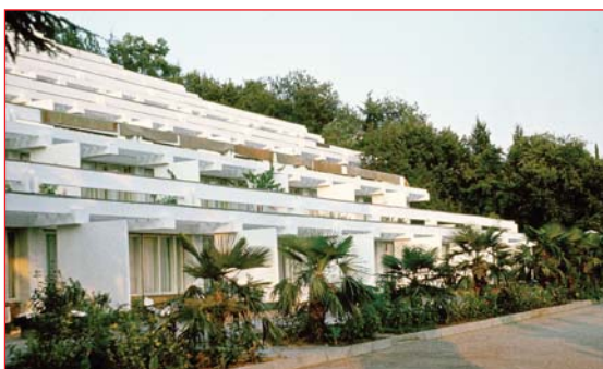
Спальный корпус лагеря на 280 мест

детский лагерь в зеленой живописной курортной зоне Алушты существует и сейчас. Приятно было прочитать, что "в детском пансионате сохранены лучшие традиции детского лагеря и что проект детской здравницы Крыма "Чайка", Алушта, в 1980 году был