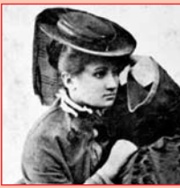
Мария Заньковецкая в 80-е годы XIX ст.

то, что благодаря ее славе театр Кропивницкого добился сенсационного на ту пору приращения – выступить на лучших сценах Петербурга и Москвы. А ведь до этого ему не разрешили работать даже в Киеве! Удивительно: столичное общество называет ее "львицей петербургского сезона", в зрительном зале звучит русская, французская, английская речь, а на сцене – украинская! Это ли не настоящий триумф украинского театра, украинских драматургов?! Мария снова улыбнулась, вспомнив, как во время ее зажигательного танца нарядные дамы и их спутники во фраках вскочили с мест и танцевали вместе с ней, а потом самые отчаянные бросились на сцену, на руках вынесли на ее середину Марка Кропивницкого и принялись качать прямо во время спектакля! Вот что произошло вчера.