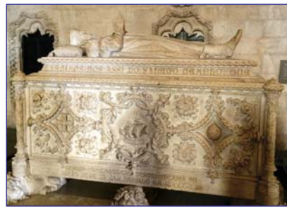
Надгробие Васко да Гама в соборе монастыря иеронимитов

1260 г., хотя еще в 50 г до н.э. Юлий Цезарь делает город западной столицей Римской империи. Изобретенные маврами широко известные, глазурированные, расписанные вручную изразцы азулежу (XII в) и сейчас радуют глаз отделкой фасадов обычных жилых домов, дворцов и церквей. Крестоносцы оставили след в реконструкции мавританской крепости-замка Св.Георгия (1147 г). Объединение готики и ренессанса дало городу во времена короля Мануэло (XVв) стиль мануэлино, отличающийся пышностью и обилием украшений резьбой по камню, тематика которых связана с морем. На берегу реки Тежу яркий пример этого стиля башня Белен (1515 г) и огромный монастырь иеронимитов с надгробием Васко да Гама.