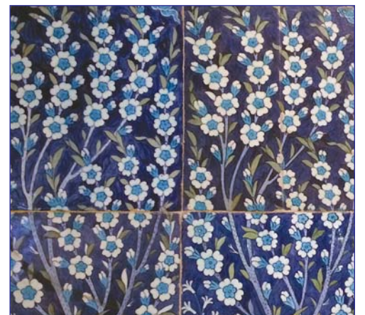
Азулежу в коллекции музея К.Гульбенкяна в Лиссабоне