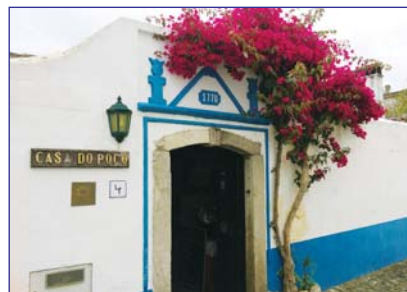
Действующий жилой дом 1770 г. в г.Обидуш