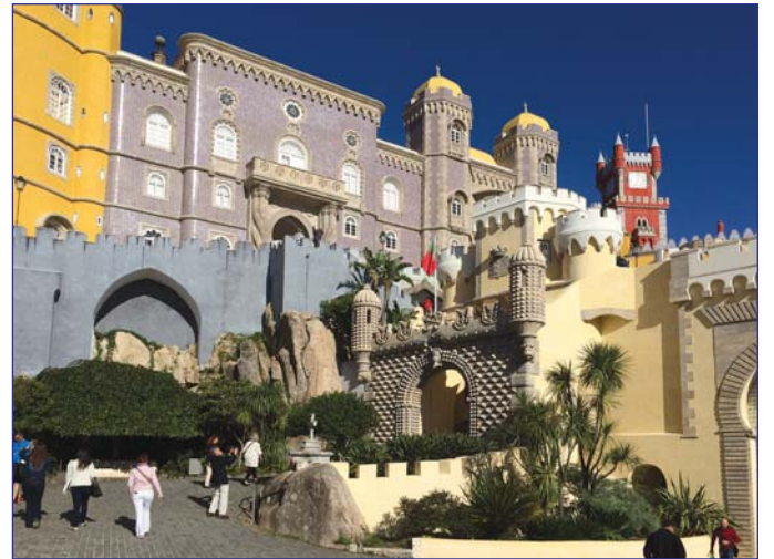
Замок-дворец Пена близ г.Синтра