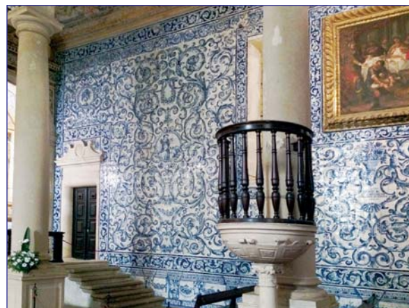
Азулежу XVIII в церкви Санта Мария в г.Обидуш

лирическая народная музыка и пение – "фаду". Песни фаду исполняются женским и мужским голосами под аккомпанемент виол. Происхождение этой музыки неизвестно, но считают, что она создана в противоположность темпераментным испанским песням и танцам. Отдельным мазком архитектурных впечатлений прикоснемся к замкам Португалии, которые воспеты несправедливо слабее, чем французские замки Луары. В 30 км севернее Лиссабона, рядом с городком Синтра, на высоте 450 м над уровнем моря в лесистой местности поражает красотой архитектурной эклектики и мощью инженерной мысли замок-дворец Пена. В нем представлены мавританские азулежу, готические окна и двери, ренессансные колонны, мануэллино отделки. Его фундаментом служит скала, интерьеры отражают вкусы королей. С высоты открывается грандиозная панорама, в которую вписывается целая череда замков с крепостными стенами, как будто копирующими Великую Китайскую сте-