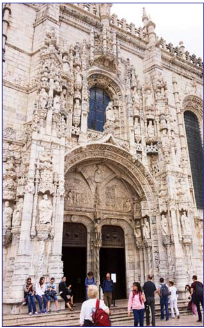
Вход в собор монастыря иеронимитов в Лиссабоне