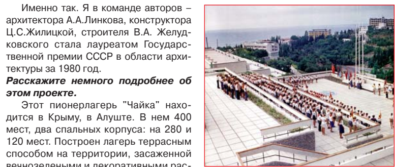
На этих террасах у детей проходили пионерские линейки.

детский лагерь в зеленой живописной курортной зоне Алушты существует и сейчас. Приятно было прочитать, что "в детском пансионате сохранены лучшие традиции детского лагеря и что проект детской здравницы Крыма "Чайка", Алушта, в 1980 году был