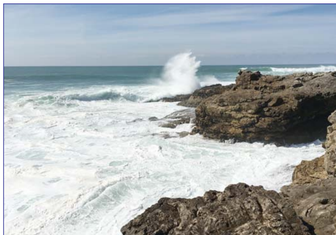
Океанский берег возле г.Кашкиреша