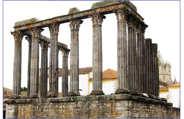
Колоннада храма Дианы в г. Эвора

Р.Ф.Рунова, профессор кафедры ТБКВ