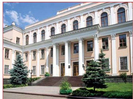
Б. Шевченко, 78. По этому адресу с 1948-1960 гг. располагался архитектурный факультет КИСИ.

Значит во время работы в "КиевЗНИИЭПе" за архитектуру пионерского лагеря-пансионата "Чайка" на 400 мест вы были удостоены звания лауреата Государственной премии СССР в области архитектуры за 1980 год?