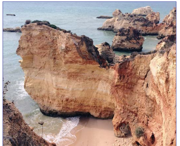
Национальный парк Алгарве