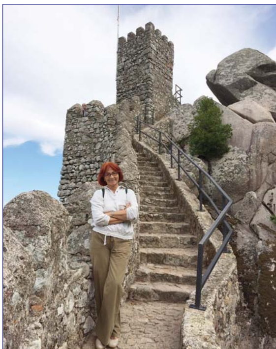
У крепостной стены королевского замка