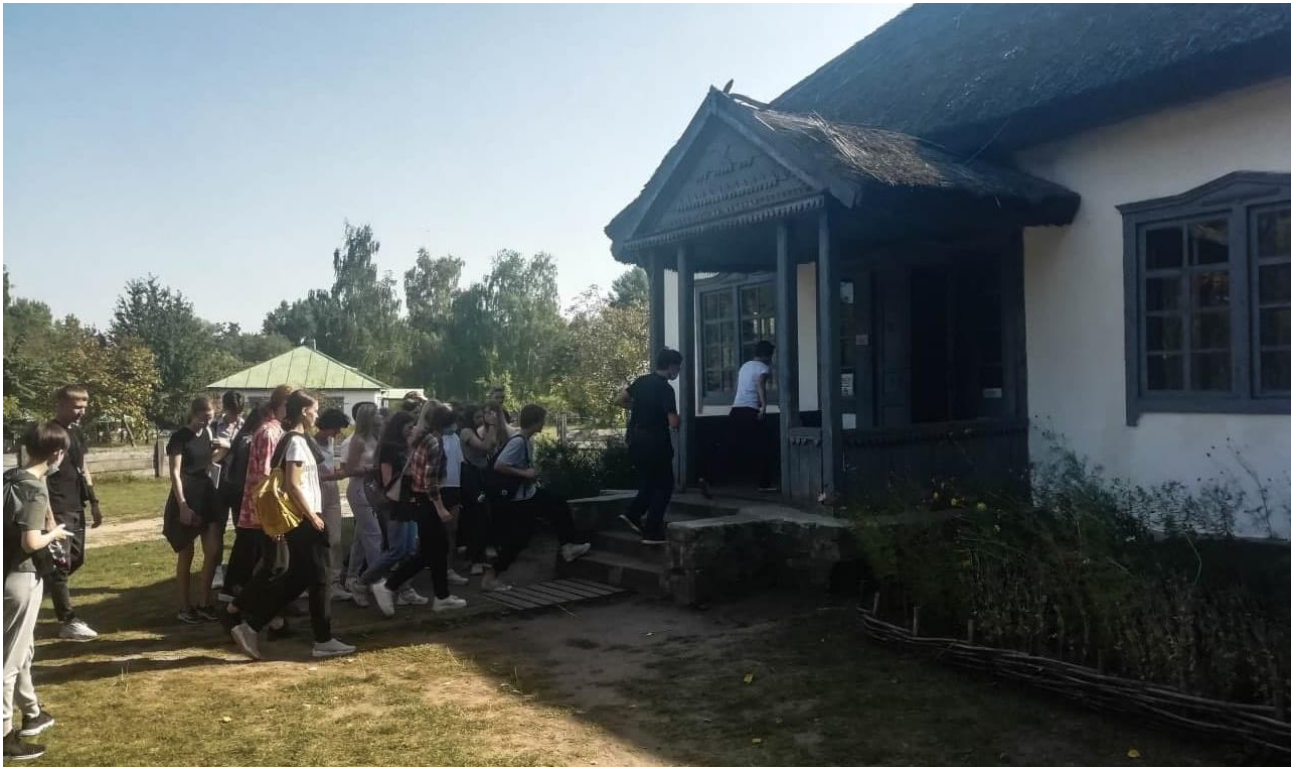
На екскурсію до трирічної церковно-парафіяльної школи з с. Лоташове

Відвідали першокурсники також один із зразків громадської забудови – церковно-парафіяльну школу з с. Лоташове Тальнівського р-ну Черкаської обл. (1903р.), що розташована в зоні експозиції Середня Наддніпрянина.