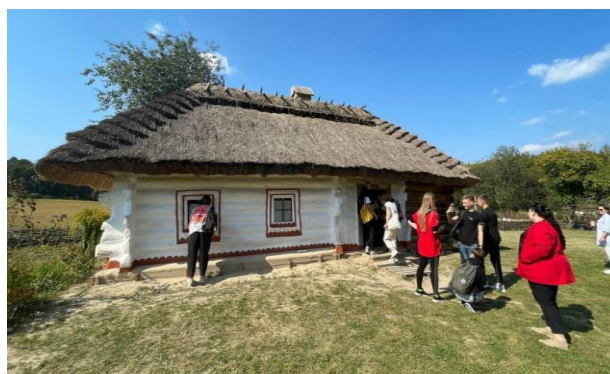
Студенти на подвір'ях музейних садиб