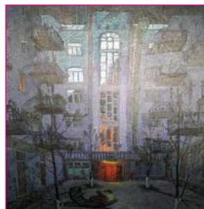
Єдиний ліхтарик у дворі...