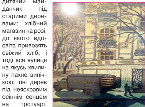
Сюди вдосвіта привозять свіжий хліб

Київ Самуїла Каплана – це не парадний фасад, яким милуються туристи, і навіть не пам'ятки архітектури чи славний мальовничий ландшафт. Художник вловив і естетично легітимізував те, про що передусім згадає пересічний киянин, думаючи про рідне місто: освітлений єдиним ліхтарем двір;