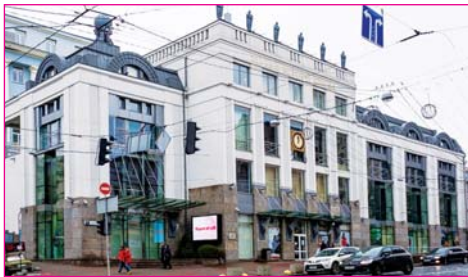
Музей історії Києва

Музей Шолом-Алейхема – не лише розповідь про життя та творчість видатного письменника, але і можливість долучитися до духовної та матеріальної культури єврейського народу. Під час екскурсії демонструються деякі обрядові єврейські предмети, предмети традиційного єврейського побуту. Режим роботи: з 10.00. до 17.00 (каса до 16.30) Понеділок: вихідний. Останній четвер кожного місяця – санітарний