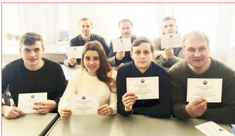
Продовження. Початок на стор. 1