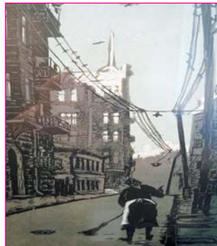
До ранку вулиця була чистою...

Виставка проходила протягом двох тижнів (25.01 – 11.02.2018 р.). Любителі Києва із захопленням відвідували картини, віддаючи данину шани майстру, якому цього року виповнюється 90 років. Фотографували пам'ятки архітектури, багато з яких не збереглися.