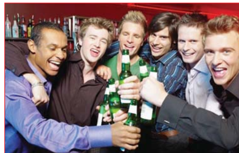
Європейці на пиві

Дівчата, якщо ваш новий знайомий-європеець каже, що не може з вами зустрітися, тому що у нього ввечері покер з друзями, не думайте, що ви йому нецікаві,