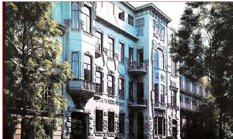
Так виглядал дом еще некоторое время назад

Наконец-то киевляне дождались сообщения о реставрации одного из самых прекрасных памятников архитектуры «Дома со змеями и каштанами». Так больно было смотреть на полуразрушенное историческое здание – одно из самых красивых архитектурных шедевров Киева.