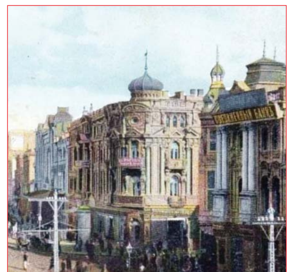
Найрозкішніші прибуткові будинки Києва

До війни ця будівля вважалася найвищим житловим будинком Києва. Споруда мала П-подібну форму та налічувала від 8 до 12 поверхів в залежності від розташування ухилу. Фасад був прикрашений розкішною ліпниною та скульптурами, у центральному фронтоні розташовувалось декоративне кахляне панно. З тераси верхніх поверхів відкривався розкішний вид на панораму частини Верхнього міста. За свідченнями дослідників історії міста, будівля сполучалася таємними ходами з Будинком Гінзбурга на вулиці Миколаївській (Архітектора Городецького). Пам'ятка була зруйнована вибухом у 1941 році, після війни була розібрана, нині на її місці знаходиться готель «Україна».