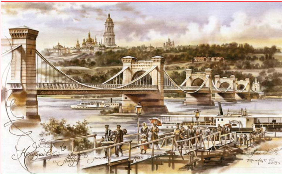
З картини художника Сергія Брандта

30 травня наш Київ – одне із найстаріших міст Європи – святкував свій День народження. Його понад 1500 літню історію не можна залишити без уваги, хоч «Архітектура та Будівництво» часто нагадує своїм читачам найцікавіше про пам'ятки свого міста, його визначних людей і просто мешканців... Сьогодні, газета розповідає про деякі втрачені пам'ятки міста Києва, краса яких залишилася лише на старовинних листівках: