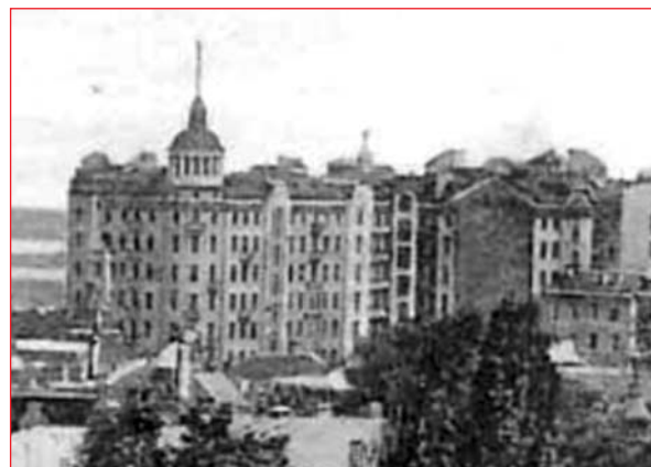
Хмарочос Гінзбурга (далі)