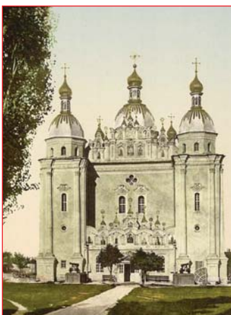
Микільський Військовий собор