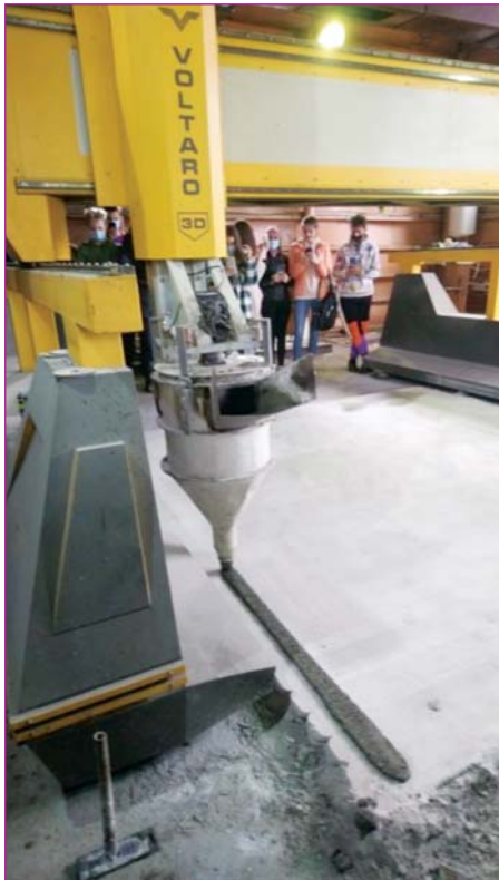
Будівельний 3D принтер – нова технологія будівництва будинків

Наприкінці травня 2021 року кафедрою будівельних технологій розпочато навчальний практикум для студентів II курсу будівельного факультету. В рамках робочої програми практикуму відбулося ознайомлення здобувачів з технологією виготовлення монолітних залізобетонних конструкцій за допомогою будівельного 3D-принтера, розміщеного в приміщенні виробничої бази КНУБА.