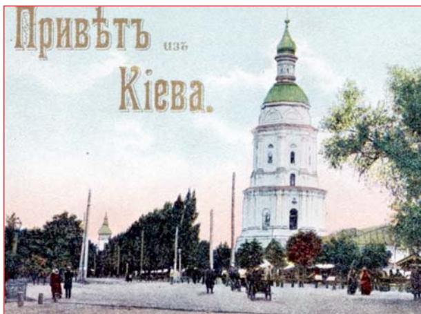
Храм Слупського монастиря «Малий Микола»

У 30-ті роки минулого сторіччя було знищено багато старовинних київських святинь. Однією із найбільших втрат для Києва стало руйнування Микільського Військового собору – унікальної святині епохи бароко.