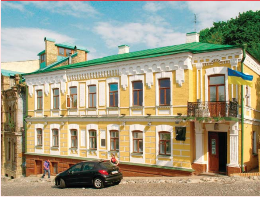
Будинок Булгакова в Києві