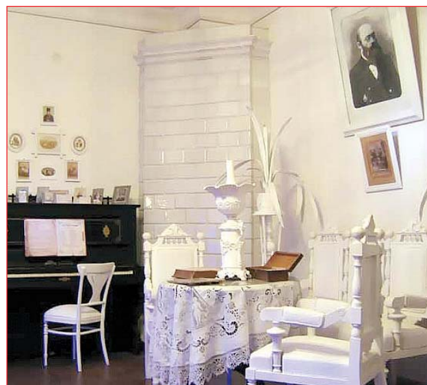
Андріївський узвоз, 13. Булгаківський куточок