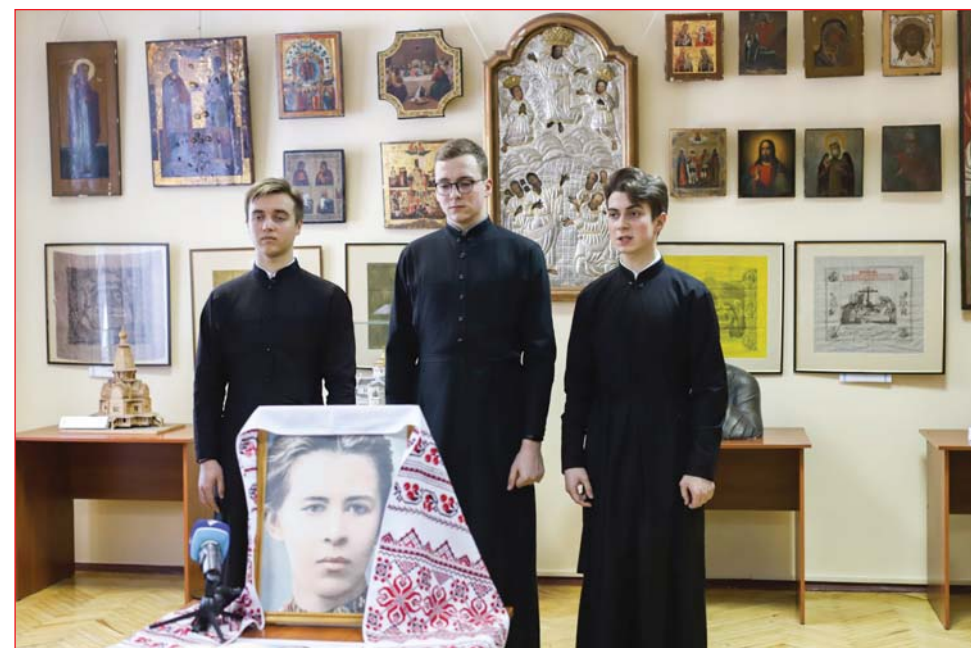
Портрет Лесі Українки авторства знаменитого українського художника Михайла Жука