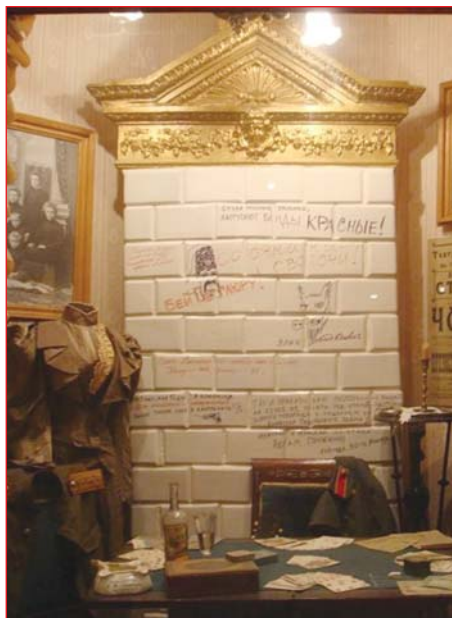
Кахельна під у будинку. 1918 р