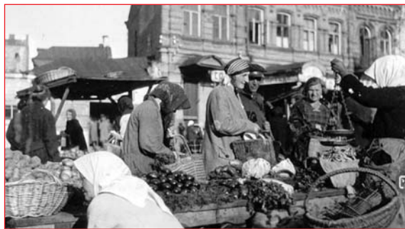
Продукты питания продавали по сходным ценам

...Нынешнее поколение не употребляет в своем лексиконе слово Евбаз . Многие даже и не слышали о таком. В самом деле, что оно означает? Ругань? Аббревиатуру какой-то базарной мафии? Сорт сирени? Старые киевляне, даже после сноса этого толкучего рынка и организации на его месте площади Победы, направляясь в универмаг, упорно ходили "на Евбаз". Потому что Евбаз был не просто крупнейшим киевским рынком, торговым «пупом» города, это был источник киевского духа, казалось, что Киев без него не возможен.