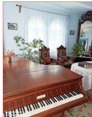
В цій кімнаті проходили музичні вечори родини Косачів.

І.Герасченкова, за матеріалами книжок та літературно-меморіального музею поетеси