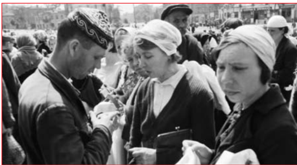
Толкучий рынок носильных вещей