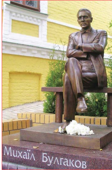
Пам'ятник М.Булгакову біля будинку музею

героїв – сім'ї Турбінних, з тих пір і стали кияни називати Будинок №13. Сьогодні – це вже не просто будівля, це Будинок-легенда і, як стверджують співробітники музею, головний його експонат.