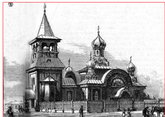
Иоанно-Златоустовская (Железная) церковь. На ее месте теперь киевский цирк

Их давно уже пора собрать в книгу. Здесь рождались и распространялись