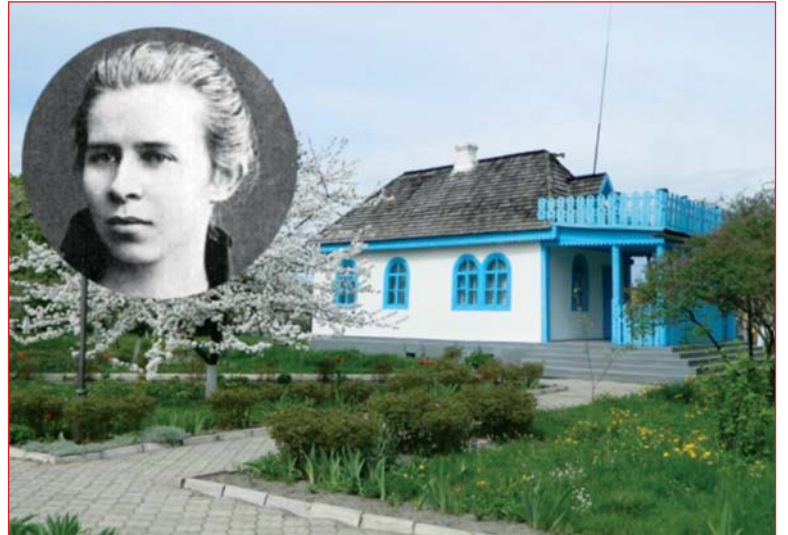
Колодяжне. Селище на Волині, де пройшло дитинство Лесі Українки. Її будинок. Тут тепер літературно-меморіальний музей.

7. Могла стати першою в Україні жінкою-композитором, мала абсолютний слух і надзвичайний хист до музики. У 5 років почала грати на роялі і написала власну музичну п'єсу. Грала вчила спочатку батькова сестра, Олександра