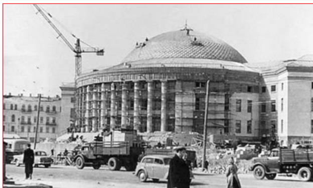
1959 год. Подходит к концу строительство киевского цирка

новости и слухи, рынок манил к себе мошенников и грабителей, а в соседних кварталах располагались ночлежки, гостиницы и нелегальные публичные дома. Здесь сбывали ворованные вещи, орудовали наперсточники, а в «обжорном ряду» готовили и тут же продавали еду и выпивку – по любой цене. Старожилы вспоминали, что на Евбазе был даже Самогонный ряд. Располагался он в районе пересечения нынешних улиц Бульварно-Кудрявской (Воровского) и Дмитровской. Товар здесь, как и на всем рынке, разрешалось пробовать. И некоторые выпивки с одним «закусочным» огурцом, подхваченным тут же, с соседнего прилавка, умудрялись «напробовать» так, что в конце ряда натурально падали с ног.