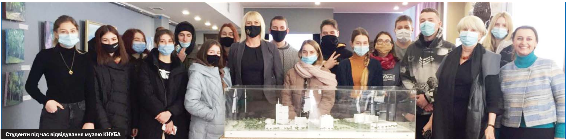
Студенти під час відвідування музею КНУБА

Кафедра охорони праці і навколишнього середовища