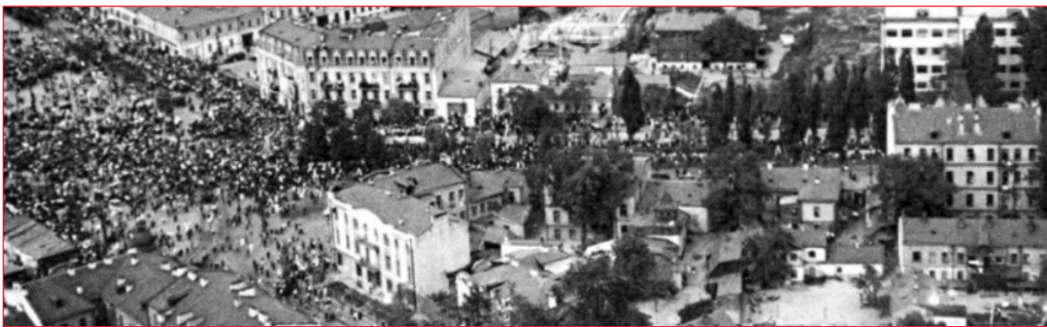
Источник киевского духа – Евбаз – на Галицкой площади в Киеве