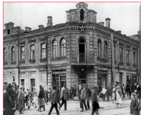
«Босаяцкий» гастроном на Евбазе

... Ликвидация Евбазы и генеральная реконструкция его окрестностей возбуждала во мне противоречивые чувства. С одной стороны, радовало, что наконец-то исчезли базарная клоака и