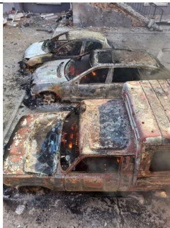
№2. втрачені залишки