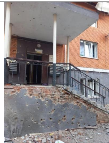
№3. двір у жалобі

Та це тільки початок: вночі підірвали два мости до столиці, на повернення годі й сподіватись. Евакуацію заблоковано (тепер багато тому свідчень про розстріли дітей, цивільних і немічних людей на переправі). Ірпінський дім зруйновано разом із припаркованим майном. Але є надія на сусідню Стоянку й вцілілу там машину, евакуюємось туди надвечір під вибухами і лише наступного ранку дорогою, закоркованою цивільною й військовою технікою, добираємось до житомирської траси.