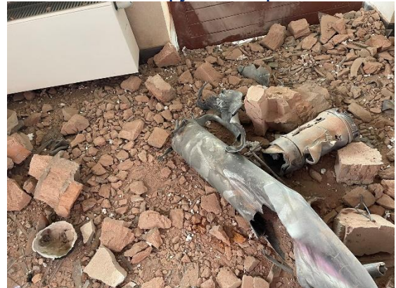
№13. залетіла «пташка»

Нотатка сьогодення. Коли онуків вже доправили в тихіше місце за кордоном, в тамтешній школі дають завдання дітям: «Намалюйте, як ви уявляєте війну». Онук здає аркуш і з путіним на шибениці, на що отримує зауваження: «Не треба так відверто, краще нейтральне щось» – домалював пожухле листя на деревах. Мабуть, ще жевріє десь «надзвичайна стурбованість», навіть після Бучі, Ірпеня, Харкова та Маріуполя.