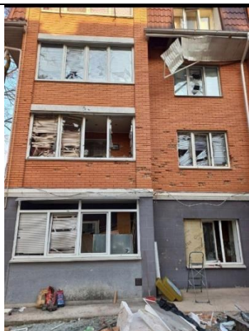
№1. перші обстріли