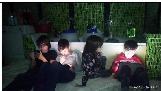
№6. хвилини дозвілля