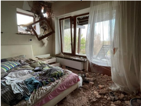
№12. одного ранку навесні