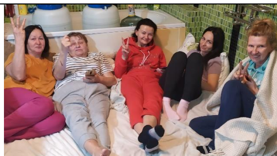
№7. нас не здолати!