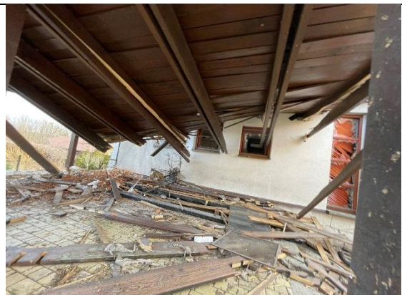
№11. «руській мір»