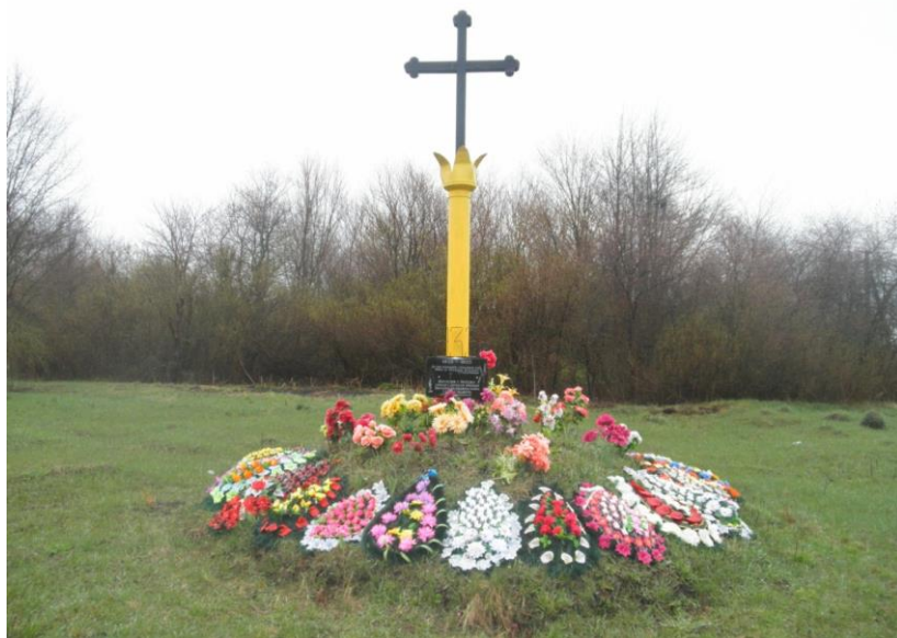
Рис. 1. Пам'ятний знак загиблим в 1932-1933рр. (с. Бесідка, Ставищенський р-н, Київська обл.)

Доповідна записка Наркомуну охорони здоров'я УСРР про стан здоров'я населення Київської області має наступні дані: 25 березня 1933 р. кількість голодуючих 398 201, померлих - 14 548; 5 квітня - голодуючих 474 540, померло - 26 479; 15 квітня - 493 644, померло - 27 809. Аналізуючи дані можемо простежити, що за 10 днів число голодуючих зростало десятками тисяч, теж саме було і з померлими, варто взяти до уваги, що в деяких селах подібний облік не вівся, тому ці числа були значно більші. Схожі дані від 6 червня показують ситуацію по районах Київщини, найбільш постраждалими є наступні райони: Богуславський 30 917 голодуючих, Білоцерківський 30 536, Ставищенський 17 129, Обухівський 14 113, Ржищевський 13 987, Рокитнянський 12 242, Сквирський 16 236, Тетіївський 10 480. В решті районів число більше 10 тисяч [1, с. 11].