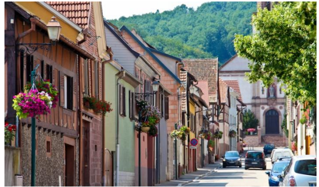
Французька модель села

Але звернемо увагу на подвійне тлумачення терміну. Одні вказують на «втечу» міщан до сільських населених пунктів від економічних, екологічних тощо проблем й часто замість «рурбанізації» вживають «руралізацію» та навіть «контрурбанізацію», інші – на прихід міського способу життя до села [1 ; 6]. Остання концепція передбачає поширення нових моделей села.