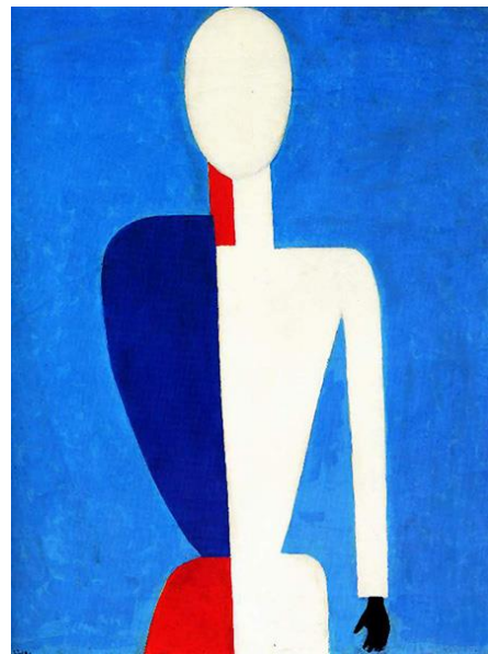
К. Малевич «Торс».