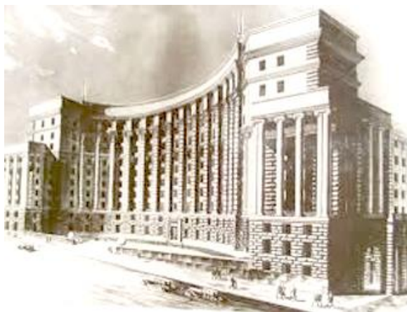
Рада Народних Комісарів УСРР

Натомість гегемоном стала партійно-державна бюрократія. Умови виникли у 1918-19 рр., коли ідею рад як «працюючої корпорації» відкинули та підпорядкували ради виконкомам [5, с. 162]. Остаточо бюрократія зміцнилася у «брежнєвські» часи, але правлячим класом вона стала у 1930-ті роки. Символом цього став й переїзд столиці з промислового та інтелектуального Харкова до Києва, осередка дрібних чиновників та буржуа. Новий комплекс адміністративних будівель Києва (особливо ЦК КП/б/У та НКВД-Раднаркому) символізував міць бюрократії, що контрастувало з революційним конструктивізмом Харкова. «Київську