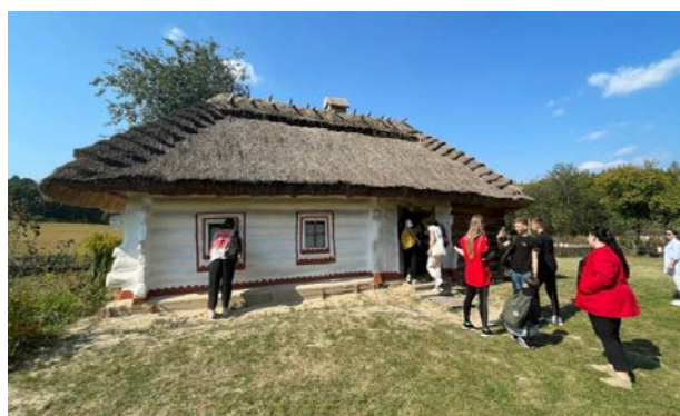
Студенти на подвір'ях музейних садиб