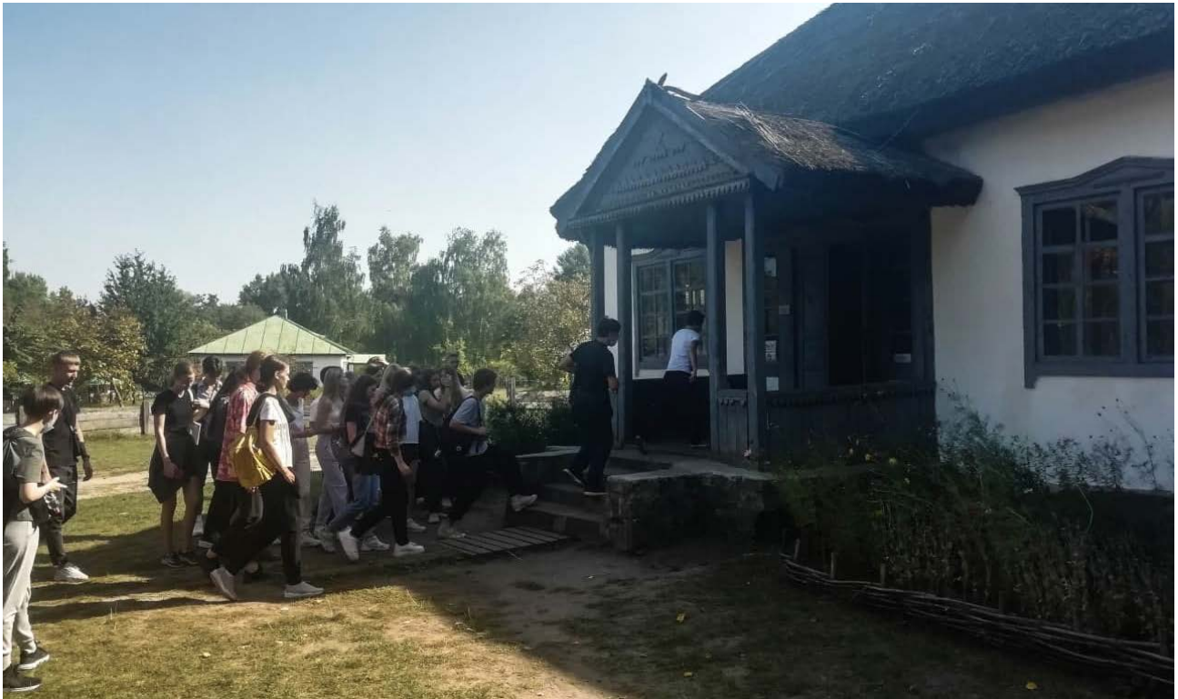
На екскурсію до трирічної церковно-парафіяльної школи з с. Лоташове

Відвідали першокурсники також один із зразків громадської забудови –церковно-парафіяльну школу з с. Лоташове Тальнівського р-ну Черкаської обл. (1903р.), що розташована в зоні експозиції Середня Наддільнящина.