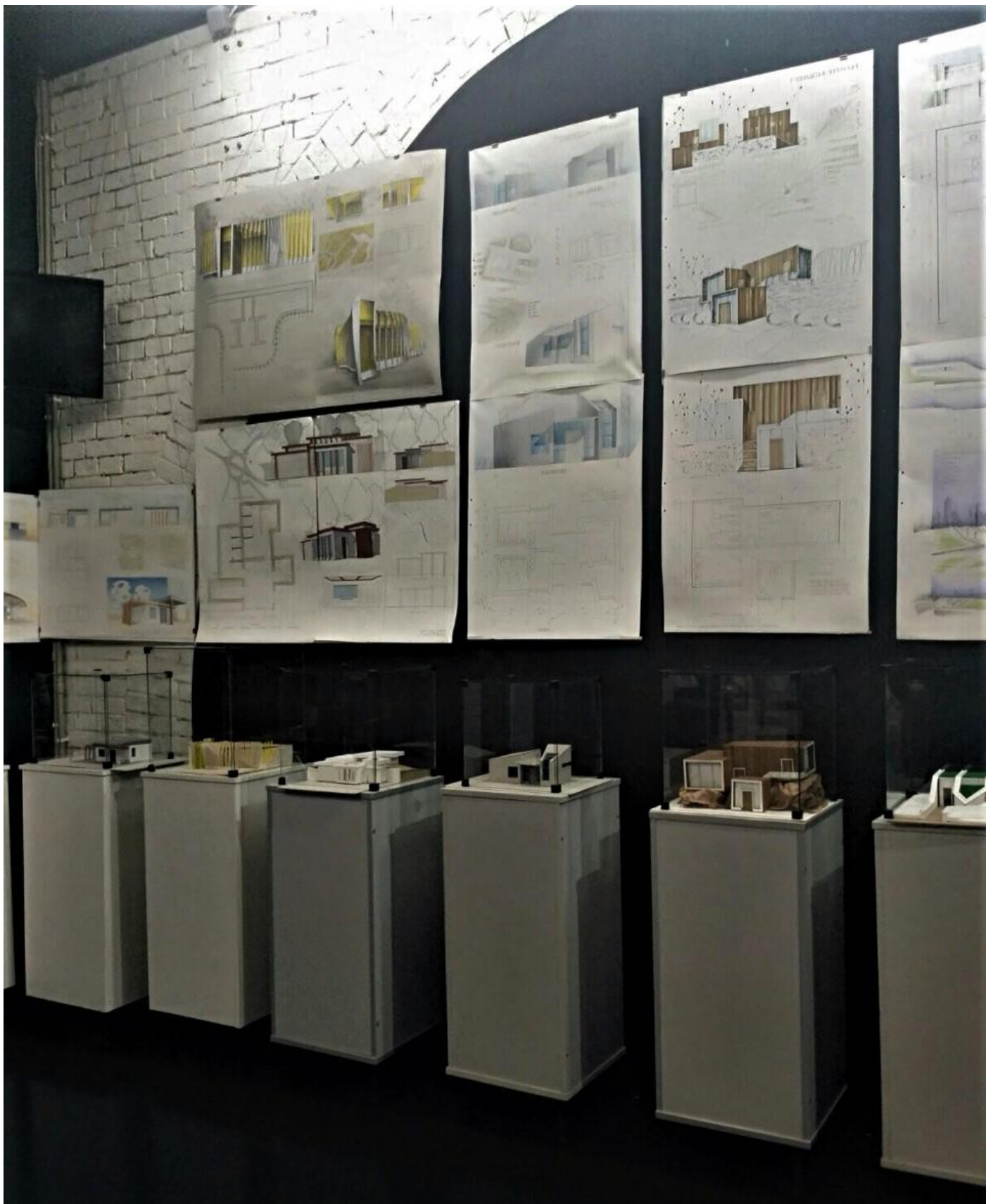
Студентські проекти громадських вбиралень в експозиції Музею Історії Туалету в м. Києві, 2019 р.