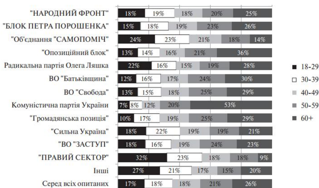
Рис.1. Розподіл електорату основних партій за віком респондентів [2]

Запит на нових політиків серед молоді також відобразився в голосуванні за маловідомі політичні сили, які не вели широкої передвиборчої кампанії. Серед їх електорату частка виборців від 18 до 29 років становила 27%.