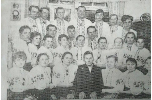
Фото 3. Сільський хор