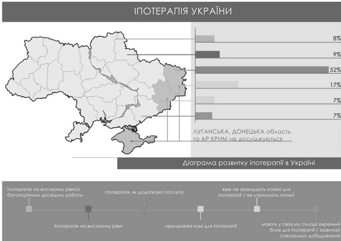
Рисунок 1.1 Іпотерапія в Україні.

3. У с. Верхня Визниця Мукачівського р-ну Закарпатської обл. також планується побудова дитячого реабілітаційного іпоцентру. Це спільний проект з Угорщиною. В даному центрі надаватиметься послуга іпотерапії, проводитиметься медична діагностика хворих та буде створена рекреаційна зона.