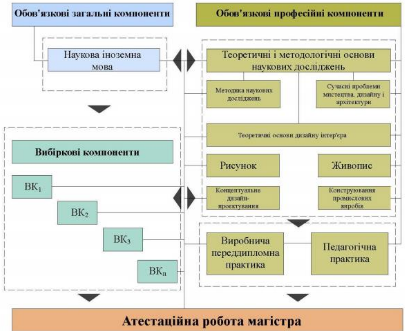
Приклад 2. Представлення структурно-логічної схеми освітньо-професійної програми «Дизайн» За другим магістерським рівнем.