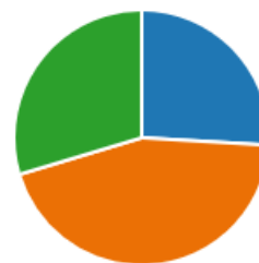
Малюнок 1. Розподіл вподобань форм навчання

Як вбачається з діаграми, зображеної на малюнку 1, більшість респондентів (44 %) надають перевагу дистанційному навчанню, на другому місці – змішана (29%), на третьому місці – очна (27%). До переваг дистанційної освіти більшість опитуваних відносять: економію часу на дорозі, нові можливості для творчого самовираження, доступ до